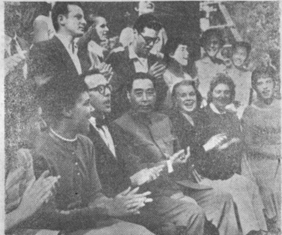
Smeječi obrazi ameriških študentov pričajo o zadovoljstvu. Kitajski premier Ču En Laj je zadržan...