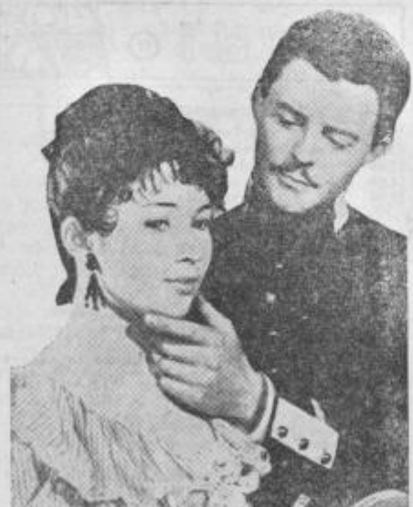
Veliki manevri: Brigitte Bardot in Gerard Philippe

Rodil se je v Parizu 1898 leta. Njegovo pravo ime je Rene Chomett. V mladih letih je bil mnogoobetajoč pe-