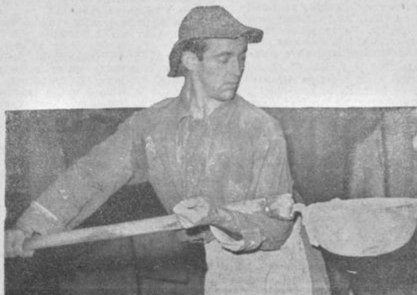
Volili so v zборе proizvajalcev

Tudi v šoštanjski občini so imeli (Nadaljevanje na 2. strani)