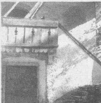
Kašča na Glinici

Pri zidani kašči iz Kamne gorice, t. j. vas vas blizu Pržanja oz. Dravelj, gre