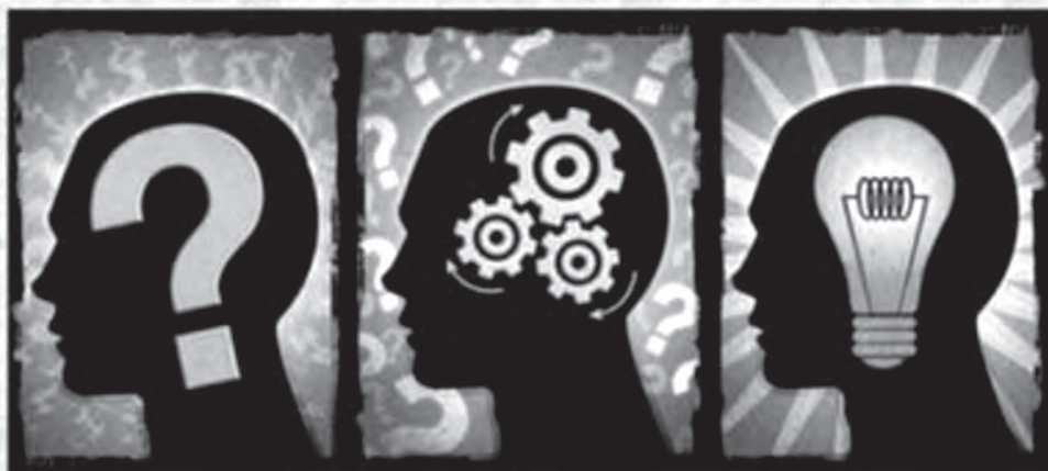
Slika: Kritično razmišljanje

Vir: Spletna svetovalnica za starše. Dostopno na URL: http://www.nezasvojen.si/vzgoja/nosečnost/spodbujanje-kriticnega-mislenja/ Uporabljeno: 2012-02-28