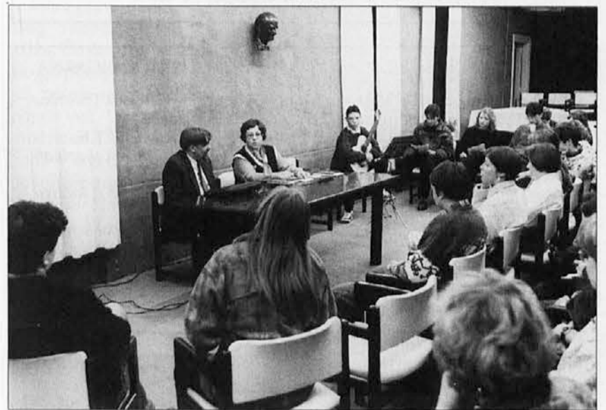
Posnetek s sobotnega večera v SKK