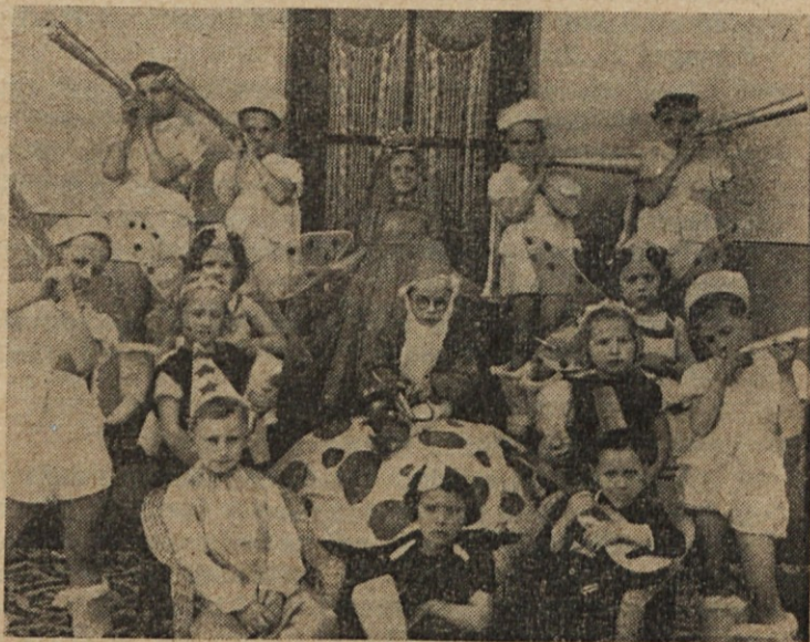
Najmlajši naši igralci e etaoia etaoia etaoa oaaa oat eoe El grupo de la "Primavera" en el Festival del 13. de sept. Najmlajši naši igralci iz veselice 13. septembra — "Pomlad".

Naj v miru počiva. Naroda, katerega je tako zvesto ljubil, ne bo pozabil pred božjim prestolom, kamor je pohitel, da bo pred najvišjim sodiščem branil slovensko pravdo. Pa tudi naš narod ne bo pozabil tega velikega svojega sina.