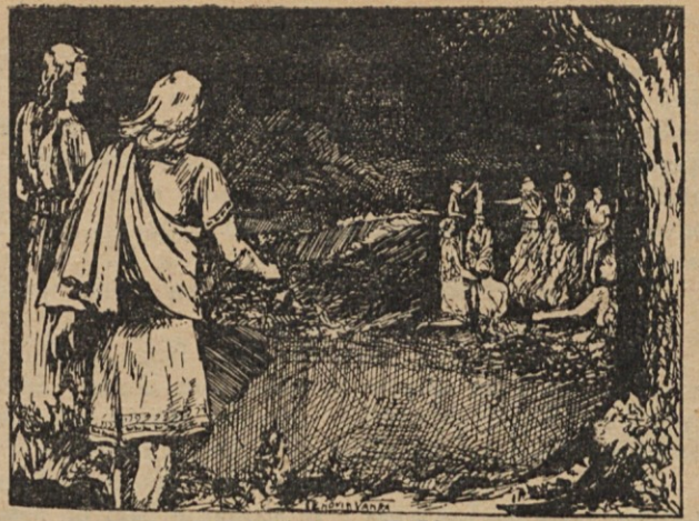
Reconocieron a Tuñús . . .

Tuñús se alzó en su lecho, para dejarse caer luego.