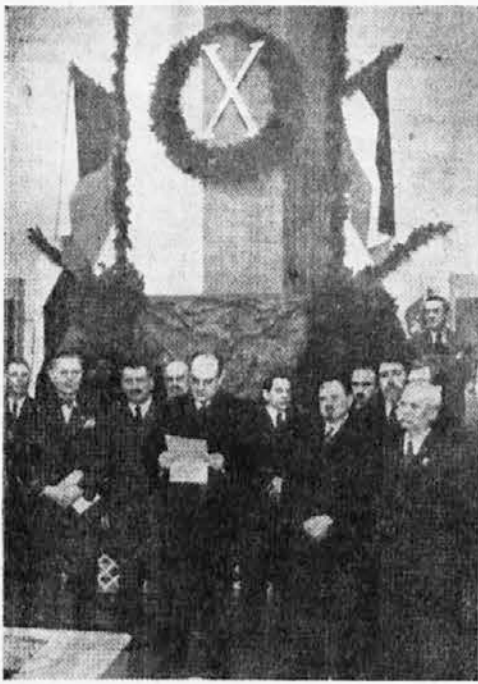
Svečano otvorenje paviljona Mislbek