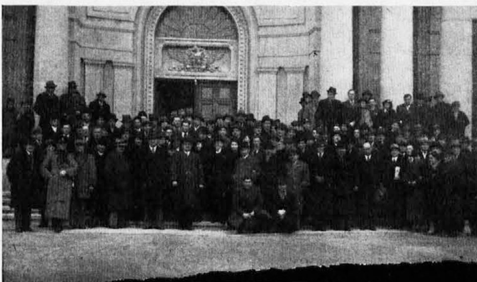
Sa godišnje skupštine Sokolske župe Petrovgrad