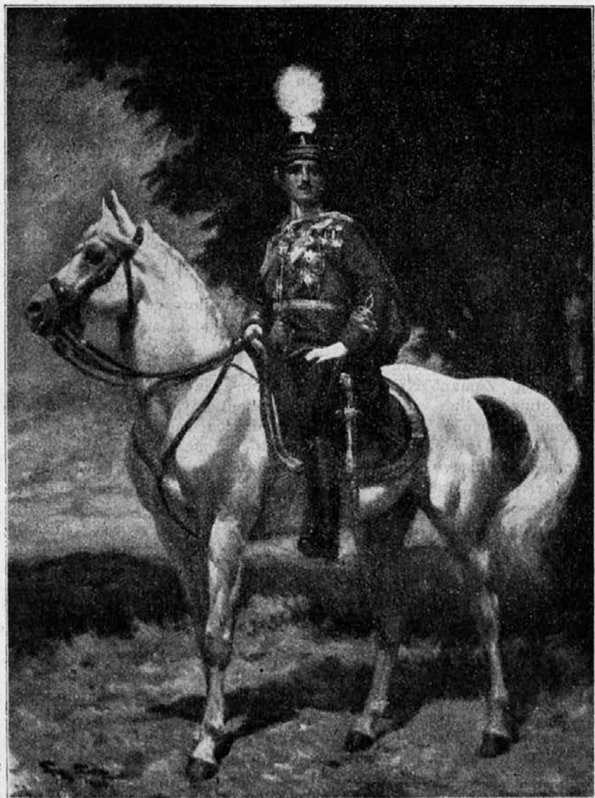
Nj. Vel. kralj Aleksander I.