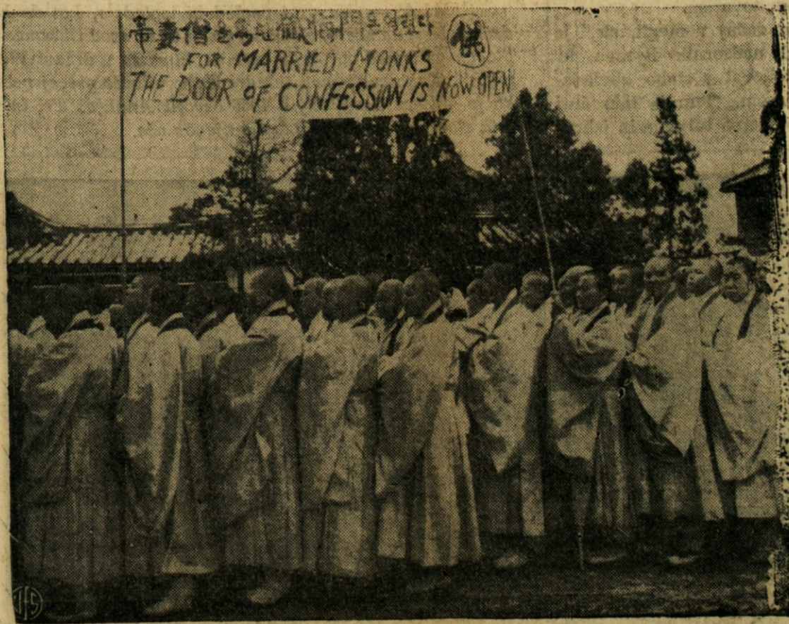
SPOR V TEMPLJIH — Med oženjenimi in neoženjenimi budistovskimi menihi v prestolnici Koreje Seulu je prišlo do hudega spora. Neoženjeni menihi zahtevajo, da njihovi oženjeni tovariši zapuste tempelje ali žene. V ta namen so vprizorili nedavno demonstracijo, pri čemer so se spopadli celo s policijo.