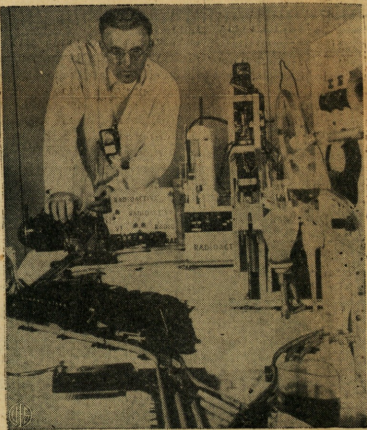
TA VLAK NI ZA IGRANJE — Vlak na sliki ni za igro, uporabljajo ga v atomski tovarni blizu Richlanda, Wash., za prevoz močno radioaktivne snovi od enega kemičnega aparata do drugega.