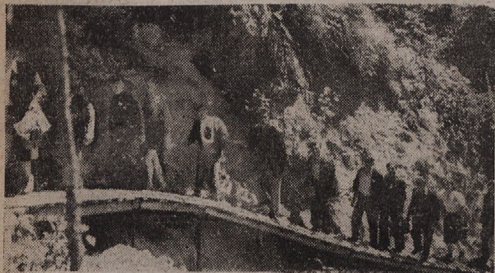
Vhod v partizansko bolnico Franjo je bil skrbno prikrit, da ga ne bi odkrili barbarški okupatorji.

Ure in ure se vlečejo poti preko mostičev po policah, tesno privite ob stene v podzemskih globine. V dolžino 5000 m in skoraj 200 m v globino so raziskane škocijanske jame in prepadi. Človeka zajame v njej vse veličastje njenih temačnih krásot, da se oddahne, ko stopi spet v svetlobo kraškega sonca, a hkratu mu daje zadostčenje, da je premagal tudi Hadove globine bajeslovnega peklá. Njeni silni vtisi zlepa več ne ubeže iz spomina.