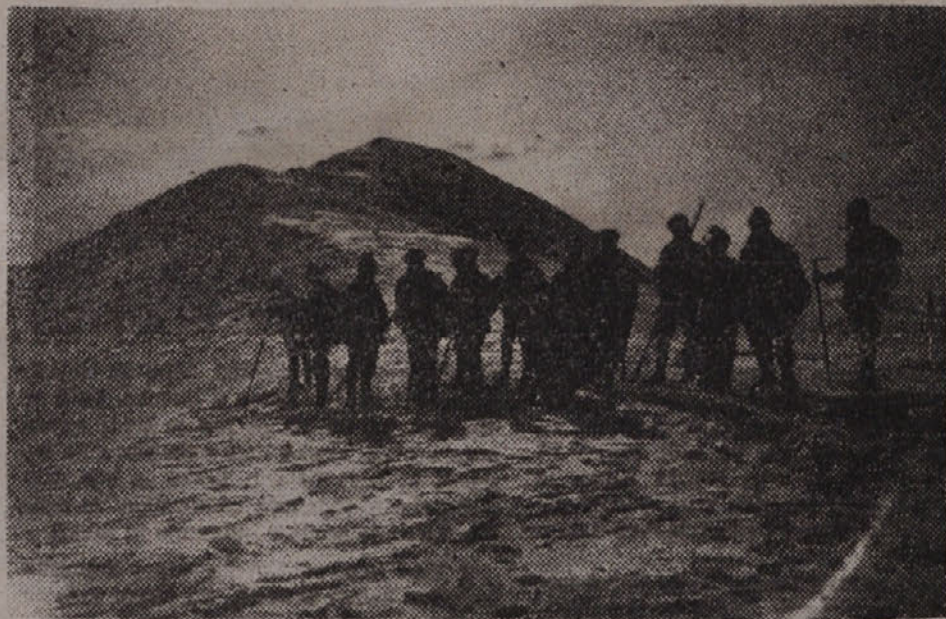
Zimski izlet na Porezen 1913. leta

hirati. Številne društvene delavce je fašizem raztepel na vse štiri strani sveta, ostalo društveno delavstvo pa je ohromil s svojimi grabežljivimi težnjami, da si zagotovi izključno posest nad našimi planinskimi in podzemskimi lepotami.