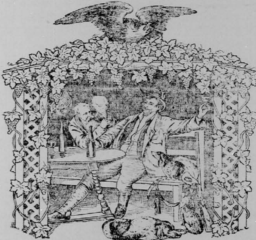
Za obila naročila se pripravite posestnik vinogradov

naznanjam, da imam na prodaj izvrstna, dobra in naravna nova vina, bodisi črna ali bela po 35ct. galona. Vse's posodo vred. Manjših naročil od 50 galon ne sprejemem. Z naročilom se pošlje polovico denarja naprej in druga polovica se plača pri sprejemu vina. Vsak naročnik vožnino sam plača. Prosim, da vsaki naročnik pošlje natančni naslov kam naj vino pošljem.