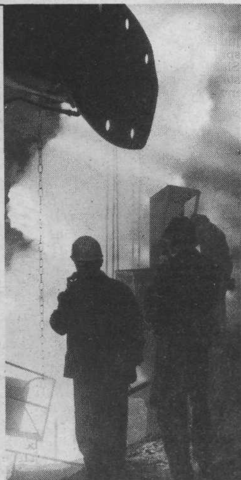
Metalke tesno sodeluje s Slovenskimi železarnami, ki so eden glavnih dobaviteljev za polproizvode črne metalurgije

Vpis je od 29. 8. do 14. 9. 1983 vsak ponedeljek in sredo od 18. do 20. ure v OŠ dr. Vita Kraigherja za Bežigradom (za stadionom Olimpije).