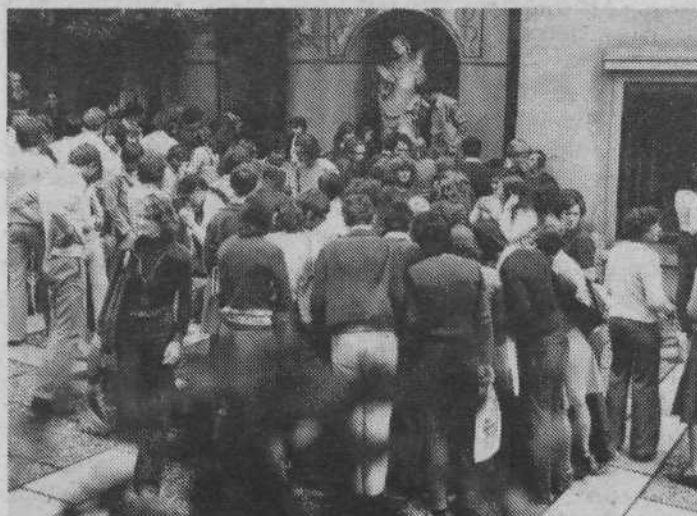
Na sejmu rabljenih šolskih knjig je vsako leto zelo živahno