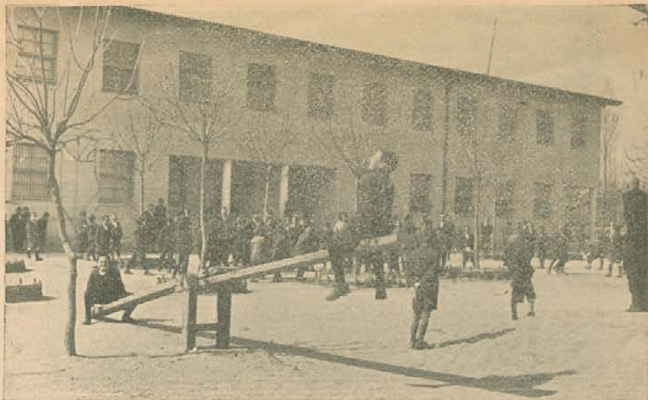
Nova zgrada, a pred njom vesela mladež...