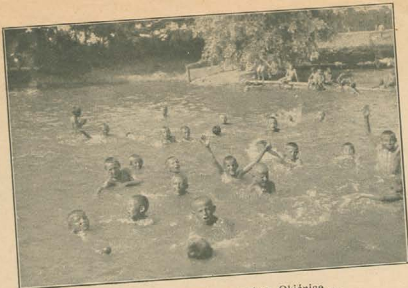
Ljeti se osvježuju bistrim vodom Okičnice ...