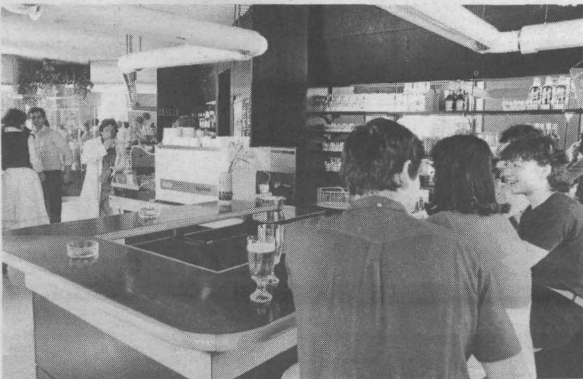
V zadnjem času so v občini Center odprli več novih manjših lokalov, kjer gostje lahko dobijo marsikaj: od pleskavic in lepinih do sladoleada in seveda različnih pijač. Sodobno opremljeni lokalčki so tako popestrili gostinsko ponudbo v naši občini, kar dokazuje tudi pogled v Brucar na vogalu Gregorčičeve ulice.