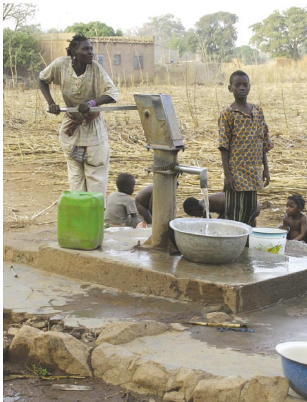
Slika 5: Večerno življenje se odvija okoli vaškega vodnjaka.

V javnih šolah je v razredu v povprečju okoli 60 učencev, marsikje pa ta številka preseže 100 učencev na razred. Eden glavnih problemov, še posebej na podeželju, je pomanjkanje učiteljev (18).