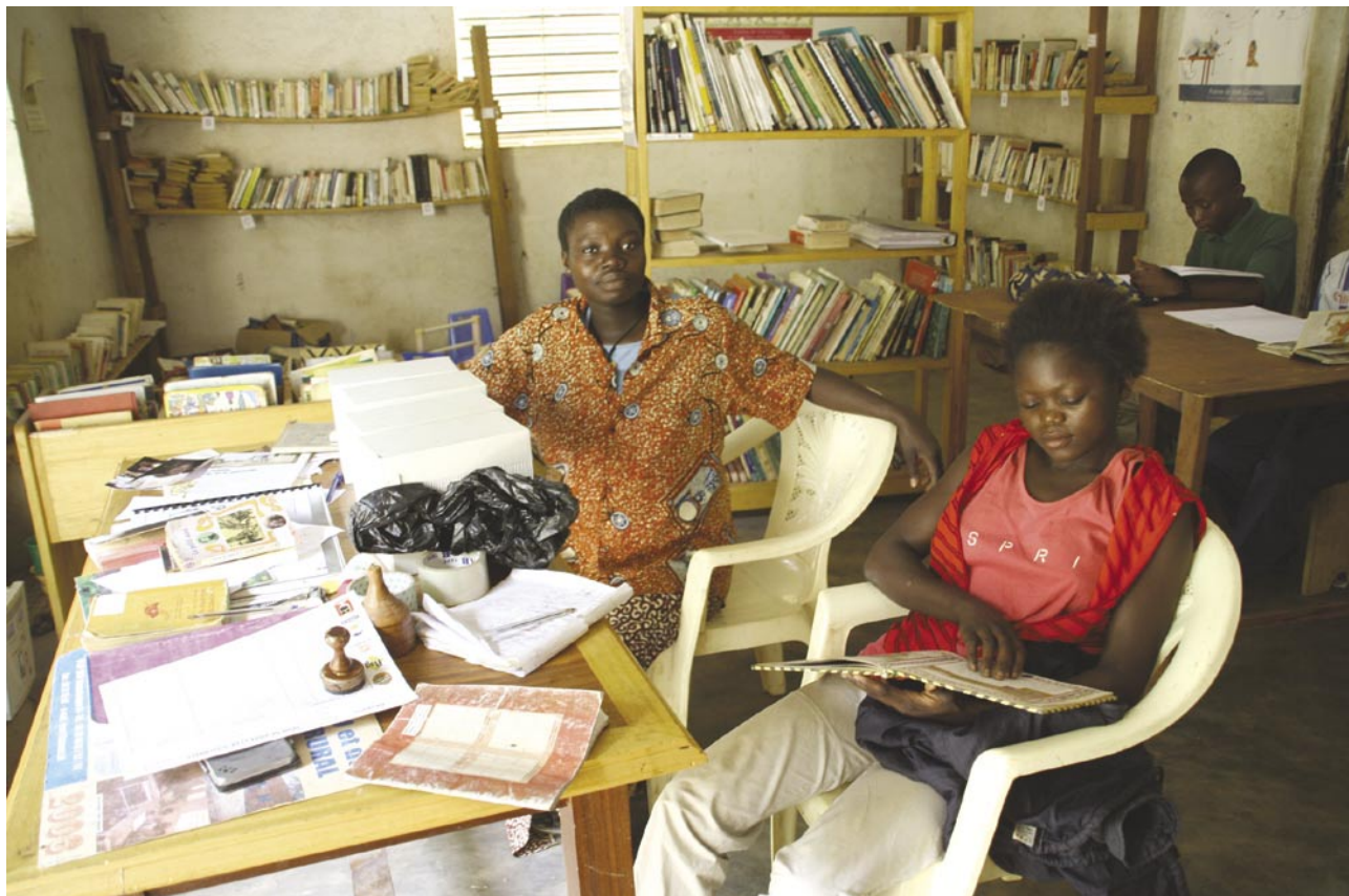
Slika 6: Vaška knjižnica v vasi Tiébélé.

Še večji problem pa slej ko prej ostaja izobraževanju nenaklonjena mentaliteta. V državi namreč ne poznajo pojma šoloobveznost. Šolnina za javne šole je sicer minimalna ali pa je sploh ni, vendar so s šolanjem povezani drugi stroški, ki si jih številni starši enostavno ne morejo privoščiti.