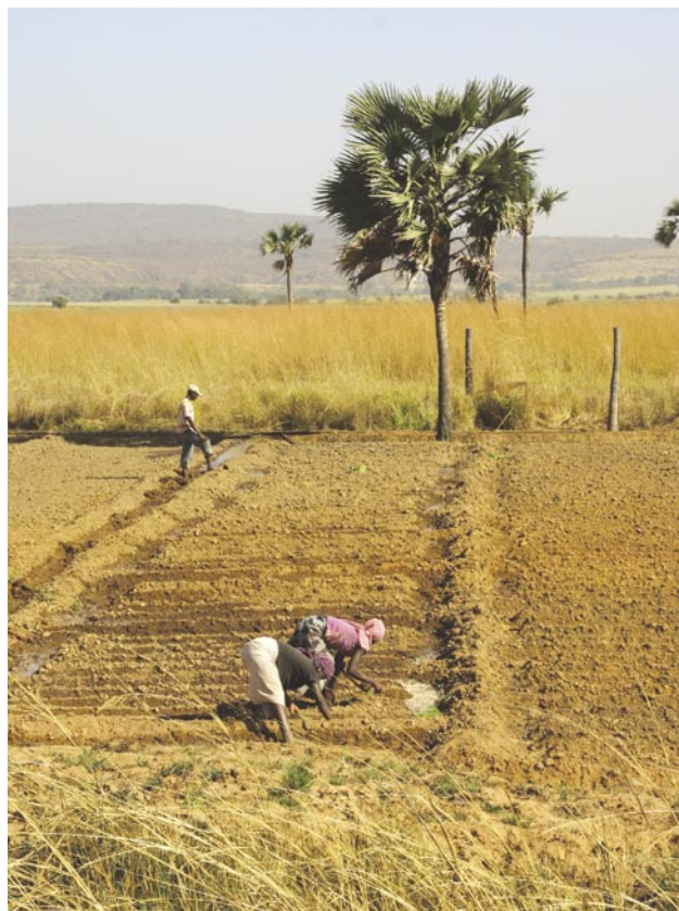
Slika 1: Namakalno poljedelstvo je v Burkini Faso prej izjema kot pravilo. Posnetek je narejen na bolj vlažnem jugozahodu države.

Prek leta se zvrstijo štiri vremenska obdobja. Zgodnje sušno obdobje traja od septembra do novembra. V zraku je tedaj še dovolj vlage, rečna korita so polna, za kmete pa je to čas žetve. Osrednje sušno obdobje traja od decembra do februarja, ko se že začne čutiti vpliv hladnejšega sušnega harmatana, ki piha s severovzhoda in prinaša prašne delce iz Sahare. To je najhladnejše obdobje, ko se začne gladina podtalnice izraziteje nižati. Pozno sušno obdobje traja od marca do maja. To je za življenje najbolj neznosen del leta, saj temperature redno presežejo 40° C.