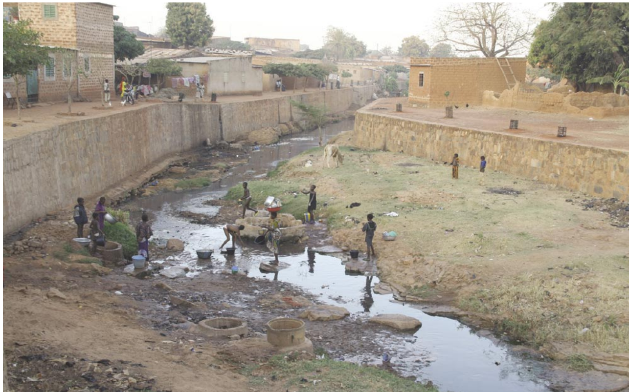
Slika 4: Skromen in močno onesnažen vodotok sredi starega dela mesta Bobo-Dioulasso ne služi le za kanalizacijo, ampak tudi za pomivanje posode.

Druge ocene pa so glede njenega naravnega potenciala bolj zadržane in polne opozoril, da so njeni dejansko izrabljivi viri omejeni, čeprav so zaloge mangana, cinka in zlata pritegnile nekaj pozornosti tujih družb (17).