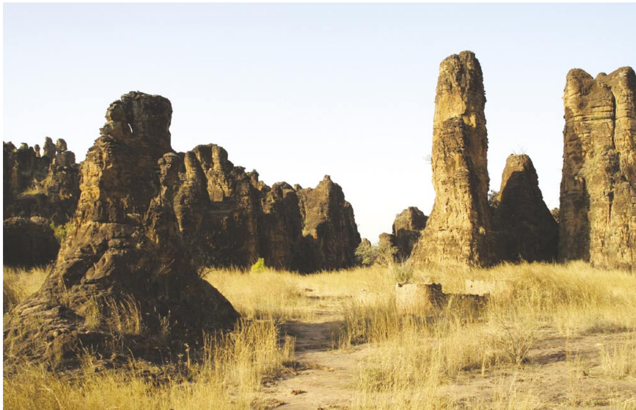
Slika 2: Sloviti osamelci Sindou so ena največjih naravnih znamenitosti Burkinke Faso.

Situacija se povsem spremeni z nastopom vlažnega obdobja , ko se začnejo iz jugozahodne smeri postopoma kazati učinki monsuna. Osušena in opustela pokrajina z nastopom deževja dobesedno ozeleni in zacveti. To je najpomembnejše obdobje kmetijske pridelave, v katerem pa naravnost eksplozivno zaživijo tudi roji komarjev in drugih insektov. Ta čas zato predstavlja tudi najbolj nevarno obdobje za izbruh malarije, diareje in drugih bolezni (5).