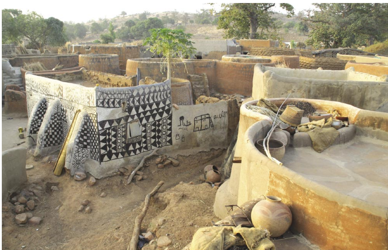
Slika 3: Slikovita vaška arhitektura v vasi Tiébélé, ki si prizadeva priti pod Unescovo zaščito.

Čeprav so kontrasti med mesti, v katerih živi 18 % prebivalstva (3), in podeželjem jasno prepoznavni, pa v državi vendarle ni moč opaziti tistih kričečih nasprotij, ki jih doživljajo nekatere druge afriške države. V mislih imamo predvsem tiste, v katerih so rudna bogastva, energijski viri ali plantažno gospodarstvo izredno povečali regionalne razlike in razslojevanje prebivalstva. Burkina Faso ima po nekaterih ocenah kar nekaj zalog naravnih bogastev, vendar ostajajo zaradi različnih vzrokov v veliki meri neizkoriščena (6). Poleg dokaj bogatih zalog zlata in mangana naj bi razpolagala tudi z bakrom, železom, kasiteritom in fosfati (11).