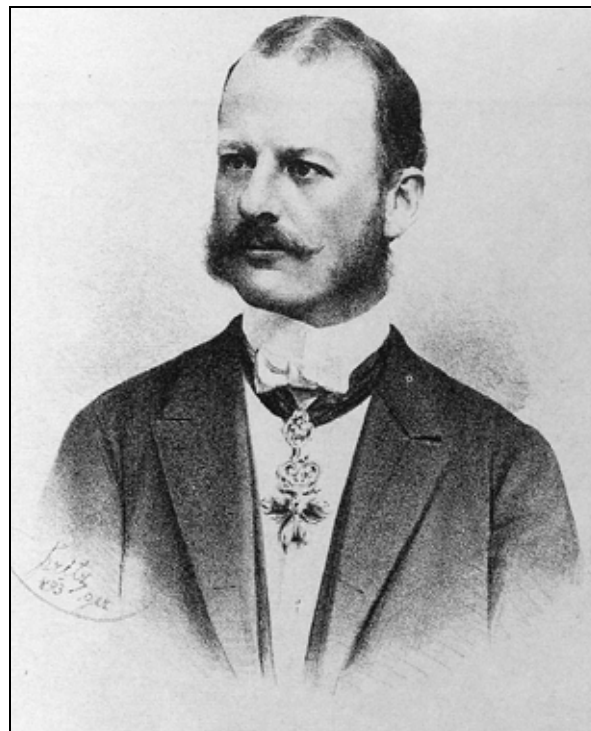
Alfred knez Windisch-Graetz (1851–1927) (Stekl, Windisch-Graetz, str. 192–193).

predsednik avstrijske delegacije od 27. V. 1893, ministrski predsednik od 11. XI. 1893 do 19. VI. 1895, predsednik gosposke zbornice od 25. III. 1897 do 12. XI. 1918. Podeljeno mu je bilo odlikovanje Veliki križ Štefanovega reda. 38