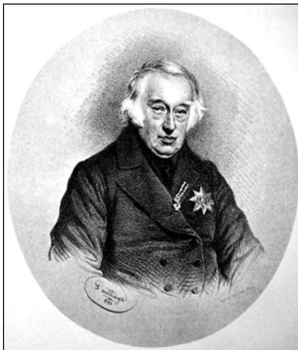
Ignaz Maria grof Attems (1775–1861) (Ilwof, Attems, str. 136–137).

Attems, Ignaz Maria , 5 grof, (1774–1861), dedni član od 18. IV. 1861, upravni jurist. Leta 1809 si je pridobil velike zasluge, ker je v napoleonski vojni skrnil orožje in državni denar v višini 6 milijonov goldinarjev. V letih 1820–1852 je bil kot naslednik svojega očeta štajerski deželni glavar. Njegova hčerka iz drugega zakona, Marija se je