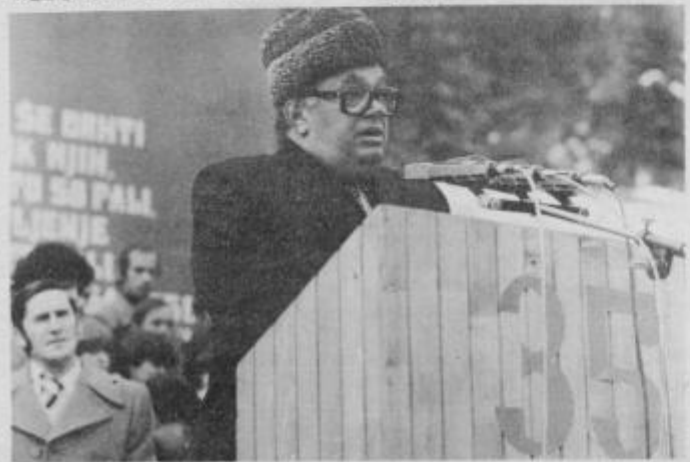
Na osrednji proslavi je več tisočglavi množici govoril Stane Dolanc, sekretar IK P CK ZKJ

Slovenska Bistrica se je v nedeljo kopala v soncu. Ljudje so bili praznično razpoloženi. Ze ob sedmih zjutraj se je začel spominski pohod mladinskih enot Pohorskega bataljona na Osankarico. Zbralo se je veliko mladih, ki so s svojo prisotnostjo pokazali in dokazali, da spošljivo negejejo pridobitve narodnoosvobodilnega boja.