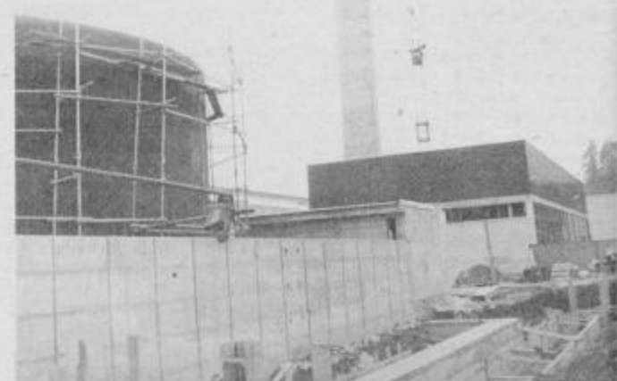
Nova toplarna v začetnem obratovanju!

Zaposleni v delovnem kolektivu IMPOL Slovenska Bistrica so letošnje praznovanje 8. januarja, občinskega praznika, obeležili še z dvema pomembnima pridobitvama, to sta nova toplarna, ki je plod skupnih vlaganj in nadaljnjih načrtovanj med delovnim kolektivom in prebivalci mesta Slovenska Bistrica.