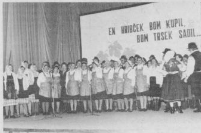
Vsi nastopajoči so za konec še skupaj zapeli...

Osnovni namen je brez dvoma dosežen — ohranjati to, kar se je