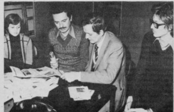
Žrebanje v studiu Radia Ptuj

Svečana podelitev nagrad bo v petek, 13. januarja 1978 ob 9. uri v sejni sobi blagovnice Mercator Panonija Ptuj.