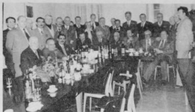
Tudi letošnje srečanje je potekalo v prijateljskem in tovariškem vzdušju