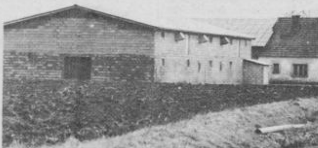
Ali bomo gradili hleve ob stanovanjskih hišah?

Ze dalj časa nastajajo spori okrog gradenj hlevov. Spor ponavadi nastane med kmetovalcem in med lastniki stanovanjskih hiš. Takšni primeri so že bili v Cirkovcih, Dornavi, Lovrencu in drugod. Do takšnih trenj in sporov pa prihaja zato, ker nobena krajevna skupnost v občini Ptuj nima urejenega zazidalnega oziroma urbanističnega reda. Sedaj je v javni razpravi dogovor o temeljnih prostorskega načrta občine Ptuj za obdobje do leta 2000. O njem bi morali v vsaki krajevni skupnosti širše spregovoriti in sicer na zboru občanov, kjer bi občani povedali svoje mnenje, predloge in zamisli. Le s pametnim in konkretnim dogovarjanjem bomo rešili vse probleme, ki nas trenutno tarejo.