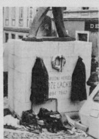
Kako varujemo spomenik v Ludbregu, ki smo povedali, kdo in odkor smo, so nam pustili napraviti posnetek tega lepega spomenika.

lanskem letu Titovih in partijskih jubilejev smo često organizirali