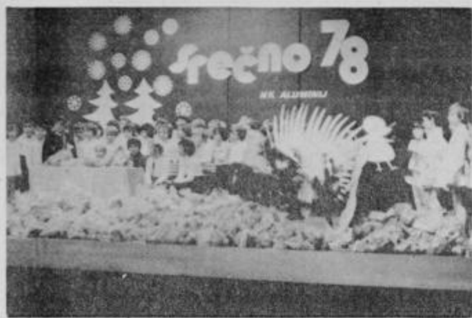
Najmlajši krajan Kidričevega so pred nabito polno dvorano in pred dedkom Mrazom izvedli res prijeten program.