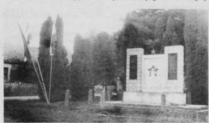
Spomenik žrtvam v Jesenovcu, kjer so v zloglasnem taborišču ustaši strahotno mučili in zverinsko pobili na tisoče ljudi, ki niso želeli nič drugega kot biti svobodni na svoji zemlji

Izjemen primer, kako znajo ljudje varovati spomin na padle borce za svobodo, smo srečali v Ludbregu, v SR Hrvatski, kjer imajo čudovit spomenik borcem in talcem, ki so darovali svoja dragocena življenja za vse to, kar mi danes imamo. Posebej velja poudariti, kako ljudje v Ludbregu varujejo ta lepi zgodovinski pomnik, saj ga brez dovoljenja