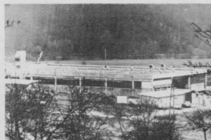
Nova tovarna dobiva dokončno podobo

Delovna skupnost osnovne šole je v začetku decembra obravnavala prednosti in pogoje za združitev v delovno skupnostjo osnovne šole Toneta Znidariča iz Ptujja v enovito delovno organizacijo. Enako stališče je sprejela tudi delovna skupnost OS Toneta Znidariča, zato je skupščina občine Ptuj na zadnji seji v decembru, kot ustanovitelj osnovnih šol, soglasno sprejela sklep o združitvi obeh osnovnih šol v enovito delovno organizacijo z nazivom osnovna šola Toneta Znidariča Ptuj. Tako bo odslej v Trnovski vasi podružnična šola. f