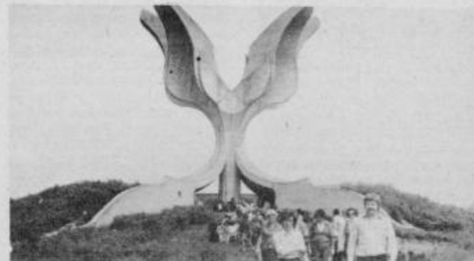
Spomenik v Ludbregu, ki smo povedali, kdo in odkor smo, so nam pustili napraviti posnetek tega lepega spomenika.