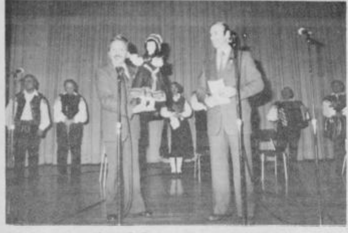
Prizor iz enega od številnih nastopov v Kanadi