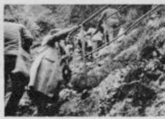
Vzpon do Titove pečine nad Drvarjem pomeni za vsakega obiskovalca enkratno doživetje

izlete v kraje, znane iz NOB, si ogledali spomenike iz epopeje naše revolucije in objubljali, da si jih še ogledamo, da pripravimo tudi svojim znancom, da jih spoznajo.