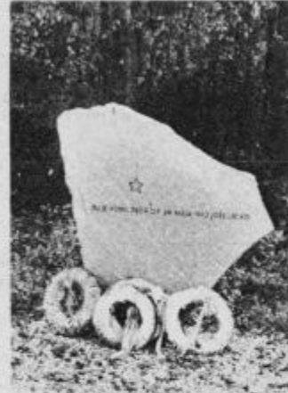
Lepo vzdrževano spominsko obeležje ob robu gozda v Kcarju