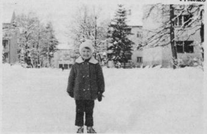
Kako dolgo bom še letos čakala na sneg?

Naloge sicer niso lahke, niso pa neizvedljive. Pri tem jim bo prav gotovo potrebna tudi pomoč ostalih družbeno-političnih organizacij in društev v krajevni skupnosti Kidričevo. F. Meško