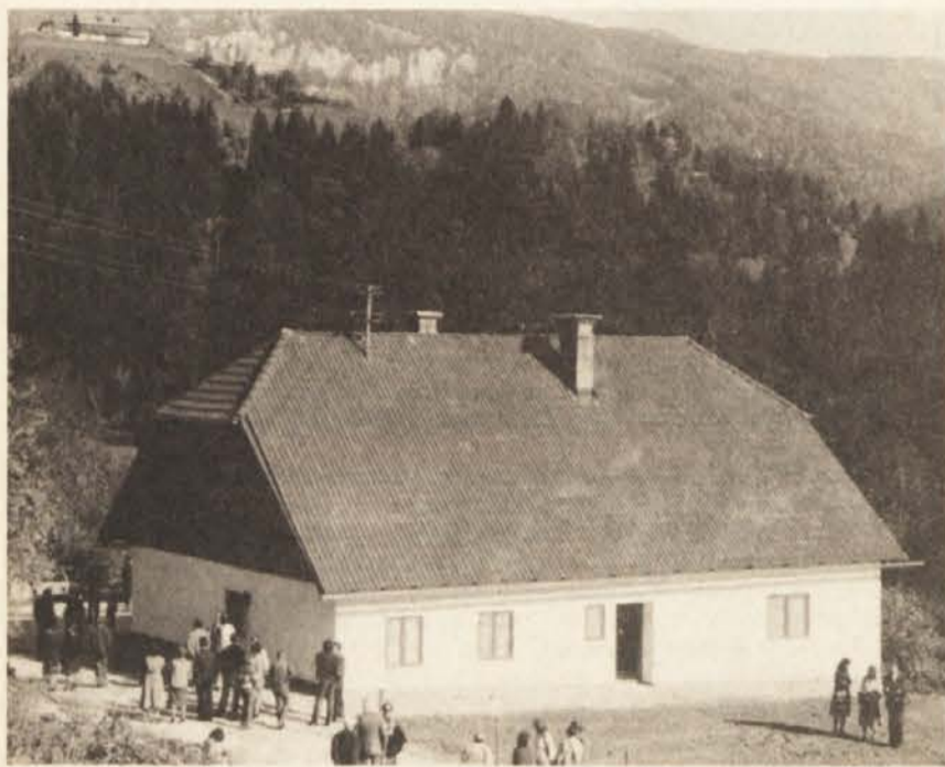
Na kraju strahotnega umora 11-članske Peršmanove družine v Podpeci nad Železno Kaplo je Zveza koroških partizanov obnovila hišo in v njej uredila spominski muzej NOB, ki bo sodobnikom in bodočim rodovom pričal o trpljenju in preganjanju koroških Slovencev za časa nacizma ter o njihovem junaškem uporu in boju proti nasilništvu.

Ob peršmanovem spominskem domu pa je ZKP obnovila tudi spomenik, ki je prvotno stal v Šentrupertu pri Velikovcu.