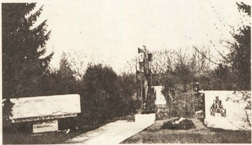
V Borovljah je na starem in medtem že opuščnem pokopališču pokopanih 48 partizanov, ki so večinoma padli šele po končani vojni – v dneh od 9. do 14. maja 1945 v spopadih z nemškimi enotami in njihovimi ustaškimi ter belogardističnimi hlapci, ki so se umikali iz Jugoslavije. Na novem pokopališču pa je poleg občinskega spomenika tudi Zveza koroških partizanov postavila spominsko obeležje.

Dne 10. 9. 1953 so spomenik raztrelili vse do danes neodkriti in nekažnovani zločinci. Avstrija, ki je po državni pogodbi obvezana skrbeti za vzdrževanje grobišč in spominskih obeležij zavezniških vojakov, prvotne oblike spomenika – umetniško oblikovane skupine borcev, ki je simbolizirala upor in boj proti fašizmu – ni bila pripravljena obnoviti in je na podstavku namestila le preprosto žaro.