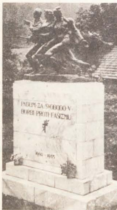
Največje partizansko grobišče na Koroškem je v Šentrupertu pri Velikovcu, kjer je pokopanih 83 borcev in bork, pripadnikov osmih narodnosti. Tej široki mednarodni razsežnosti protifašističnega boja na Koroškem so izrekle svoje priznanje tudi štiri zavezniške sile: njihovi predstavniki so se udeležili tako prekopa padlih partizanov kakor tudi odkritja spomenika.

Ob peršmanovem spominskem domu pa je ZKP obnovila tudi spomenik, ki je prvotno stal v Šentrupertu pri Velikovcu.