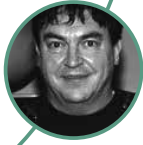
Vladimir Pirc Zavod RS za šolstvo