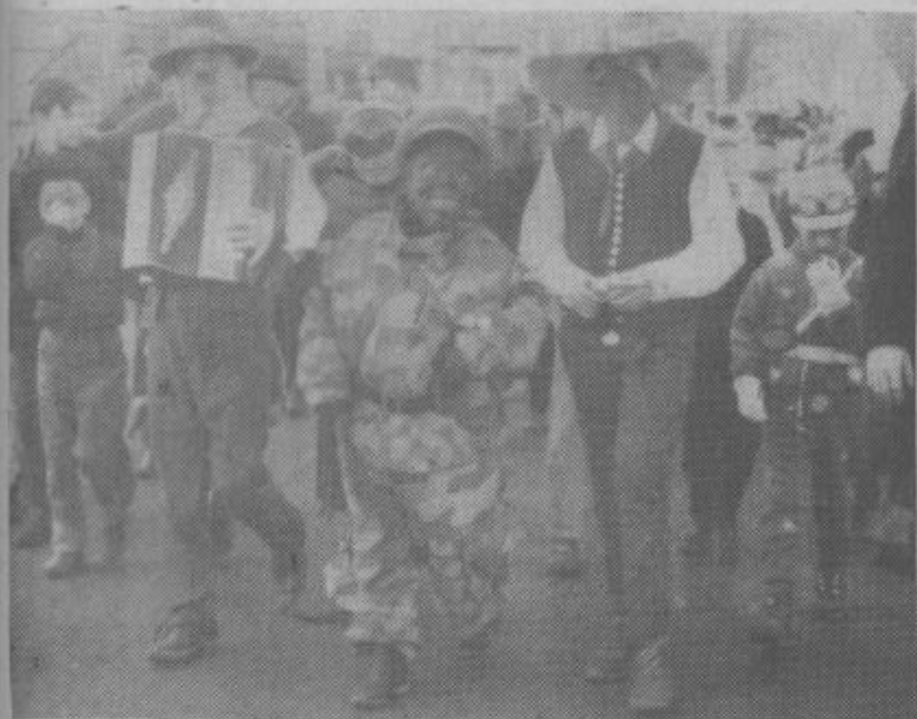
To fotografijo smo posneli na otroški maškaradi v Šoštanj, ki jo je priredil TVD »Partizan«. Sami veste, dragi otroci, kako je bilo tam veselo. Podobno pa so se na pustni dan zabavali tudi drugje.