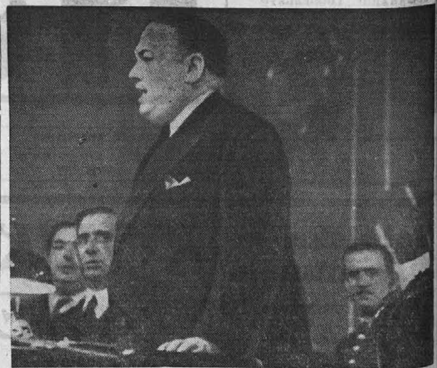
Martinez Barrio, ki je iz navadnega tiskarja postal predsednik španske republike, govori v parlamentu.