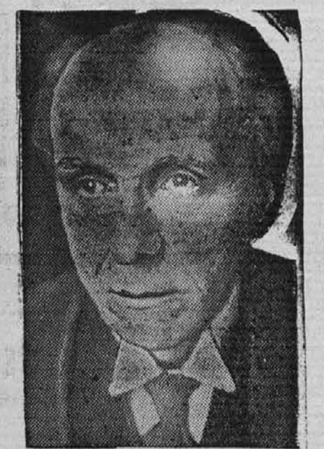
Lord Cecil zahteva, da se Anglija bolje oboroži

Nihče pa bi ne bil bolj vesel nego mi, če bi ta naš pesimizem v resnici ovrgla — dejanja!