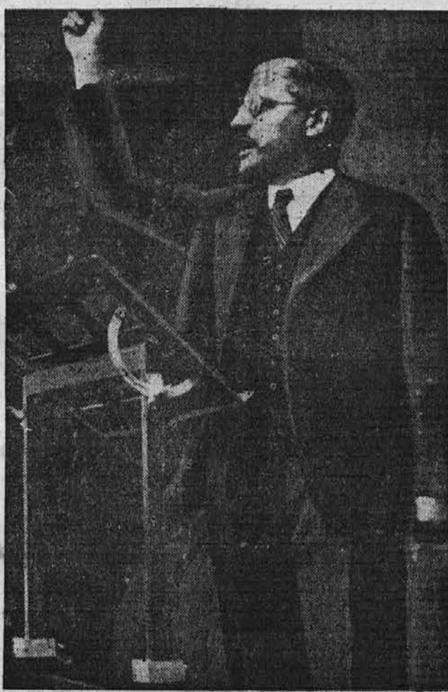
Avstrijski kancelar Schuschnigg, novi diktator

Poleg tega pa so morali zapustiti deželo še nekateri drugi Evropejci, med njimi celo francoski nadškof v Harrarju, ki je v Abesiniji opravljal misijonarsko službo.