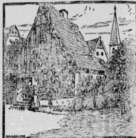
Kje je deklica?