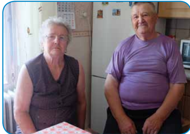
Bautini Feri pa žena iz Slovenske vesi

»Sprvoga sem nikan nej odo delat, samo doma sem delö, te leta 1968 sem üšo delat na Vodno gospodarstvo. Tam smo skrb mogli meti na potö-