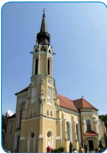
V cerkev svetoga Imrena so inda ojdli - zdaj pa pá odijo - iz avstrijski vesnic

Znautra v iži vidimo indašnjo künjo, štera je sploy takša kak vogsrke, slovenske ali ro-