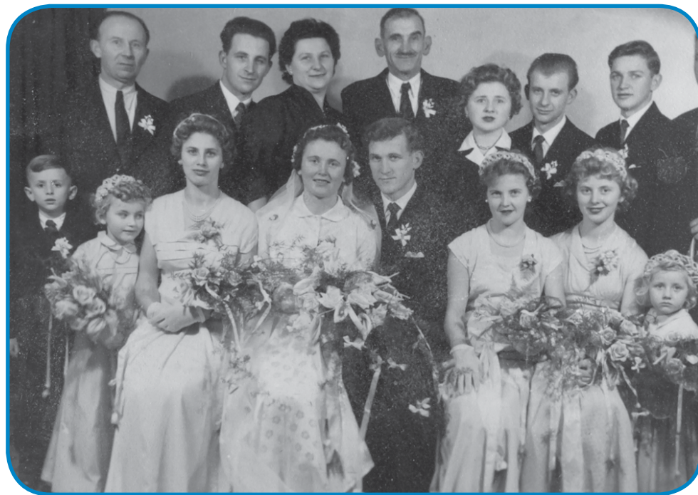
Zdavanjski kejp, na sterom - vüpamo - ka se dosta lidi spozna

vöseko, če je stoj grdo vodau nutrapiščavo, kakšna voda teče iz Avstrije, če je pa povaudan bila, te smo pa merili, kak visiko stoji voda. Štiritrestni lejt sem delö na tau ednom mesti, pa te od tistac sem üšo v penzijo. Samo dočas, ka sem dja v slüžbo odo, doma smo ranč tak gazdüvali. Gda smo z dela domau prišli, te smo doma tadala delali. Zdj se naša mladina žaurga vsigdar, ka tjelko