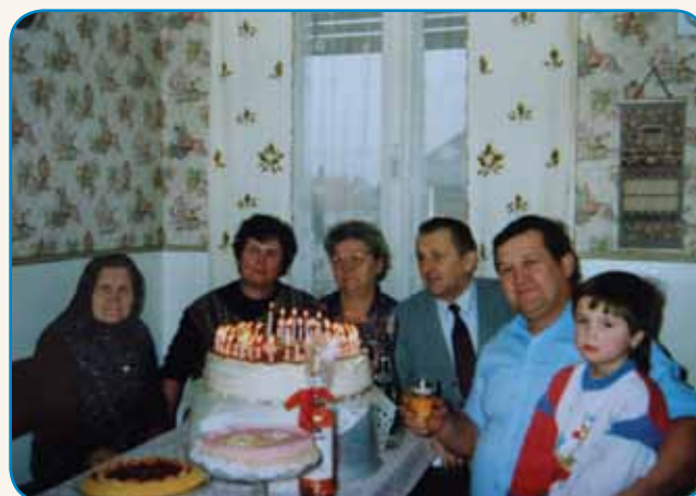
DVAKRAT BI LEKO ZEMLAU KAULAK ZOPOJDO stran 8