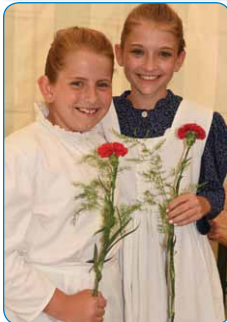
Mladi Sinčarici sta vsakši skupini dali klinčac pa diploma

Folklorne skupine ZSM Gornji Senik, štero so v največšoj porabskoj vesnici stvaurili pred več kak trestimi lejtami. Plešejo porabske, prekmurske pa štajerske plese, leta 2008 pa so prejkvzeli veuko narodnostno priznanje PRO CULTURA MINORITATUM HUNGARIAE. Na III. LIPAFEST-i so nupokazali farbasti splet: med