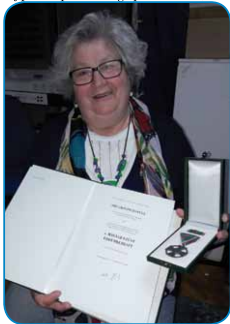
Red za zasluge s srebrnim križom ji je podelo madžarski predsednik János Áder

grünti nemo ostala, ka mo mogla titi dale v srednjo šaulo, zatau se morem navčiti slovenski gezik. Dokejč sam nej prestaupila šolskoga pr-