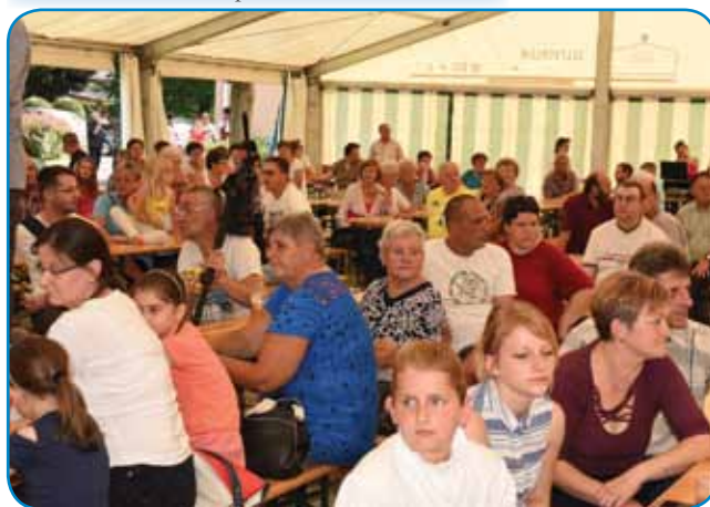
Šator so napunili Slovenci pa Madžari

Folklorne skupine ZSM Gornji Senik, štero so v največšoj porabskoj vesnici stvaurili pred več kak trestimi lejtami. Plešejo porabske, prekmurske pa štajerske plese, leta 2008 pa so prejkvzeli veuko narodnostno priznanje PRO CULTURA MINORITATUM HUNGARIAE. Na III. LIPAFEST-i so nupokazali farbasti splet: med