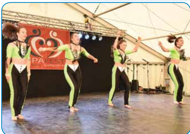
Dinamični ples Sobočank

tradicijo koroške pa zahodnoštajerske krajine, med plesom spoj dosta spejva tō. (Edno od njini pesmi smo leko prepoznali kak našo »Gda zrankoma rano gorstanem«.) Na porabskom festivalu je člane sprejajo mali ansambel s fudami, tubov pa klarinetom, plesci so plesali lepau gladko pa pomalek. (Istina pa je, ka so moški gnauk kumas zdignili svoje pare v bejli avbaj pa bejli štrümfaj.) V drügom tali svojoga programa je FS REJ nutpokazala polke pa valcere v spleti »Ob košnji«.