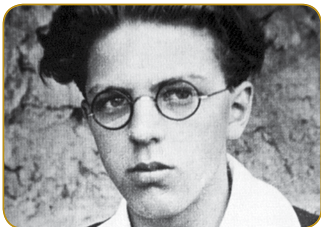
Srečko Kosovel je biu človek s Krasa - eden od pesnikov, šteri so prerano mrlí

Cajt »slovenske moderne« je trpo do konca prve svetovne bojne. Z letom 1918 - gda je mrau Ivan Cankar - se začne čas takzvanoga »ekspresionizma«, šteri se konča kauli leta 1930. Po tistom je najbolje krepek »socialni realizem«, šteri trpi prejk druge svetovne bojne pa segne vse do leta 1950. Literatura kisnejši