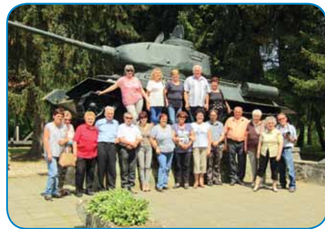
Sombotelski Slovenci pri sovjetskom tanki v Nemesmedvesi

Sombotelski Slovenci smo zmolili eden očanaš pa zdravamarijo ino zaspejali Marijino praušgarsko pesem »Je angel gospaudov«, pa malo eške - v gnešnjom slobaudnom