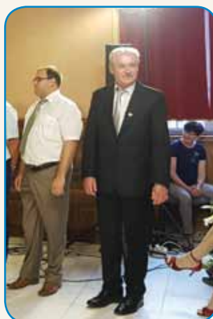
OB DNEVU PEDAGOŠKIH DELAVCEV stran 7