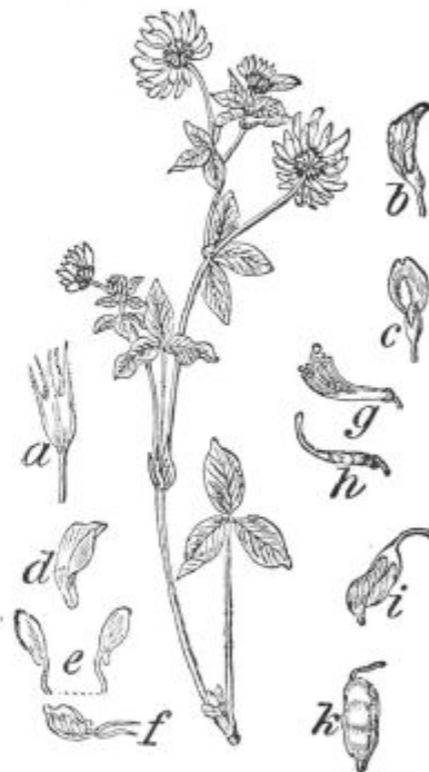
Podoba 10. Švedska detelja s cvetnimi deli in s stročkom.

Seme švedske detelje; a v naravni velikosti; b in c 7krat povečano.