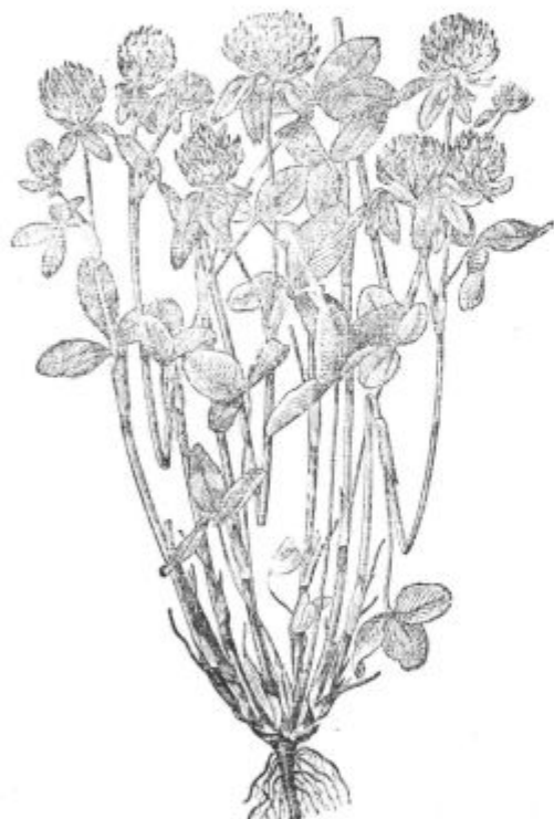
Podoba 6. Domača detelja v cvetju.

Reja plemenskih svinj se bo omejevala na tiste kraje, kjer jo že imajo in kjer so pogoji za njo ugodni. To velja na pr. zlasti za spodnji del Dolenjske (novomeški, krški in mokronoški okraj) in za kamniški okraj na Gorenjskem. Ti kraji so poklicani, da zalagajo s praseti druge kraje. Belokranjska se mora šele postaviti na svoje noge, ker ima ugodne pogoje za tako rejo. Po drugih krajih bo pa reja plemenskih svinj ostala le