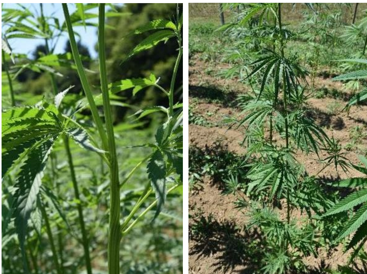
Slika 2: Primer dveh atipičnih rastlin; levo – rastlina z zavitim stebлом in dvema vrhovoma; desno – rastlina s prevelikim številom preozkih lističev v listih