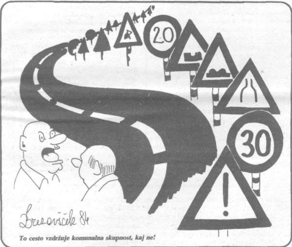
To cesto vzdržuje komunalna skupnost, kaj ne!

Spričo teh finančnih težav komunalna skupnost ugotavlja, da ne bo mogla kriti vseh prevzetih obveznosti iz sredstev nadomestila za uporabo stavbnega zemljišča za letošnje leto. Sredstva bo namreč morala nameniti za kritje anuitet, pa čeprav se je odpovedala realizaciji občinskega programa v celoti.