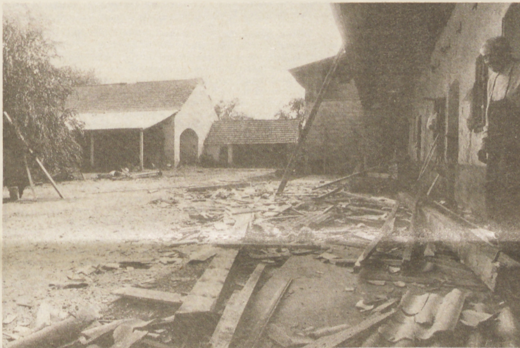
Pravi orkan je največ škode povzročil na domačiji in gospodarskem poslopju Puconjevih na Cvenu. Na dvorišču so ostanki strehe, ki jo je vrglo dobrih 100 metrov daleč, nekaj plošč kritine pa so morali iskati tudi 300 metrov daleč.

pe za odpravo posledic neurja, v prihodnjih dneh pa bodo skušali oceniti vso škodo, ki je nastala. Dušan Loparnik