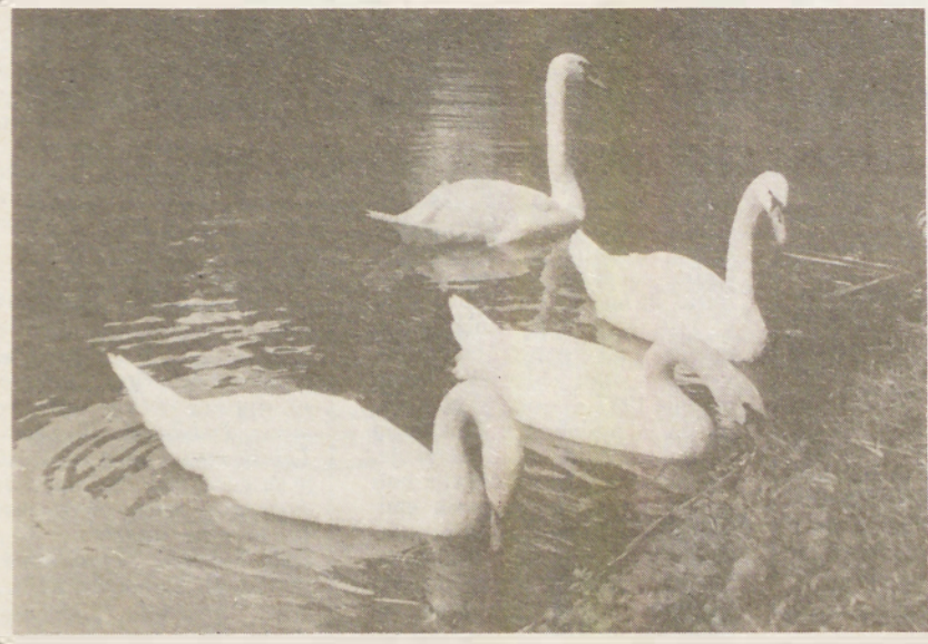
Tale pernata, dolgovrata četvorka si je našla mirno mesto v eni od pomurskih gramoznic. Upajmo, da je ne bodo pregnali kakšni nadležneži.