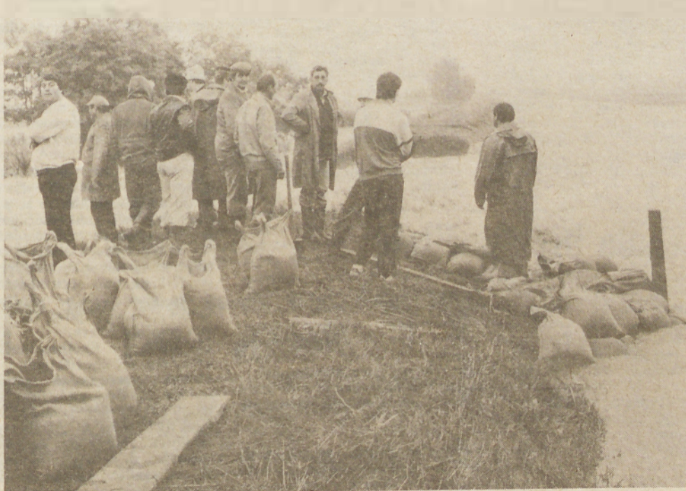
Ledavski razbremenilni kanal je nedaleč od Agroservisa predrila voda. S pomočjo civilne zaštite, vojakov in drugih občanov so vodo ukrotili.

nost ljudi, da bi pomagali, je bila hvale vredna. Zelo dobro je potekalo tudi obveščanje preko centra pri občinskem štabu za civilno zaščito. Zatikalo pa se je predvsem pri pomanjkanju primerne materiale za zagrajevanje.