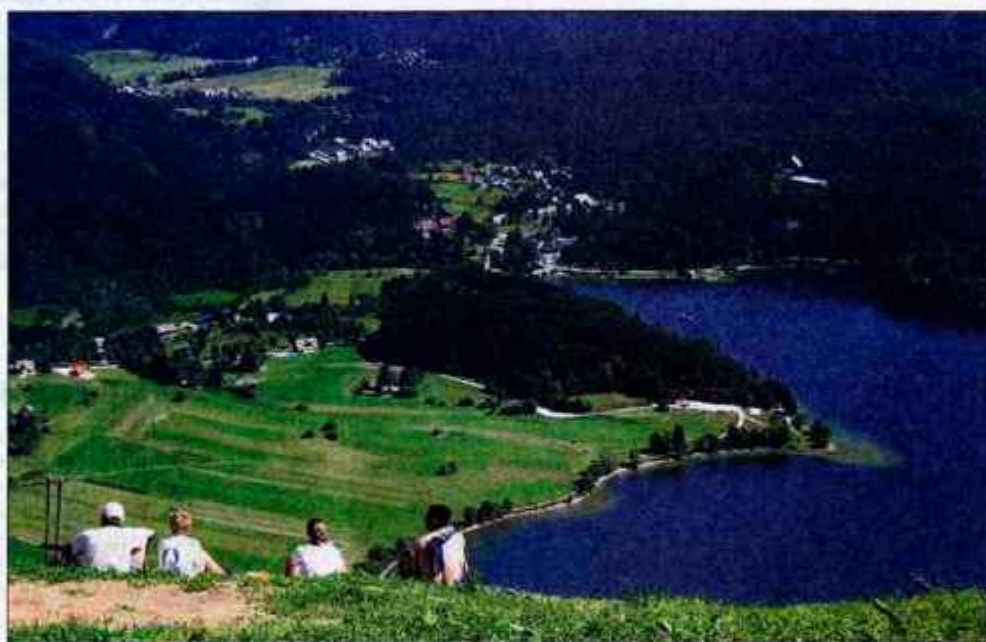
Eden lepših razgledov na Gorenjskem.

Bohinj je znan po svoji zimski sezoni, ko smučarske spretnosti in znanje preizkušamo na bližnjem smučišču Vogel. Poleti pa se lahko z gondolo odpeljemo do zgornje postaje in potem nadaljujemo pot peš. V bližini domačije pri Ukcu, ki je od Bohinjskega jezera oddaljena le nekaj minut hoje, privre na dan slap Savica. Bohinja gotovo ni treba predstavljati kot izhodišča za planinske ture, saj samo do Triglavu vodijo trije dostopi: Dolina sedmerih jezer, dolina Voje in Pokljuka.