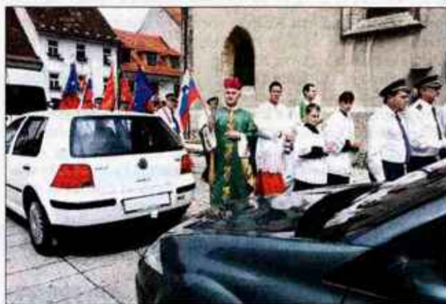
Krištofova nedelja v Kranju.

Sveti Krištof je imel god v nedeljo, 25. julija. O njegovi veliki priljubljenosti med Slovenci pričajo številne podobe v nadnaravni velikosti na stenah cerkva in tudi na skalah ob rekah. Rodil se je v Palestini in pri krščanskem krstu so mu dali ime Krištof, Christophoros (Kristonosec). Na otoku Samosu je umrl mučeniške smrti. O Krištofu so krožile številne legende. Postal je zavetnik zoper naglo in nepredvideno smrt. Po postavi naj bi bil orjak, zato se