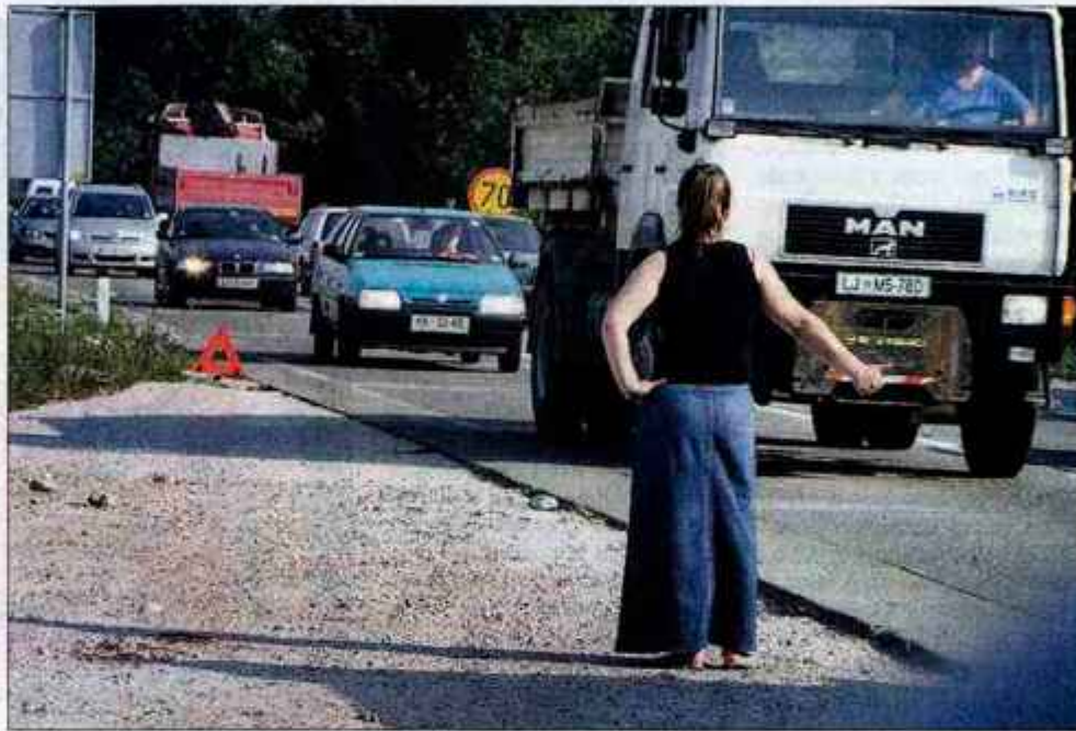
Palec dvignjen, učinka pa nobenega.

Spet štopam. Nervozno se prestopam in obračam glavo za avtomobil. Mimo jih pelje še okoli petdeset. Ura je devet in petinpetdeset minut. Na postaji ustavi avto starejše znamke. Stečem do njega in odprem sovoznikova vrata. Prijazen brkati možakar ponudi prevoz. Vztrajam, naj raje pogleda moj avto. Naj mi avto pregleda mehanik, reče. "Če bodo avto popravljali drugi, vam bodo še kaj dodatno pokvarili," mi svetuje. Mudi se mu v službo. Pustim, da odpelje.