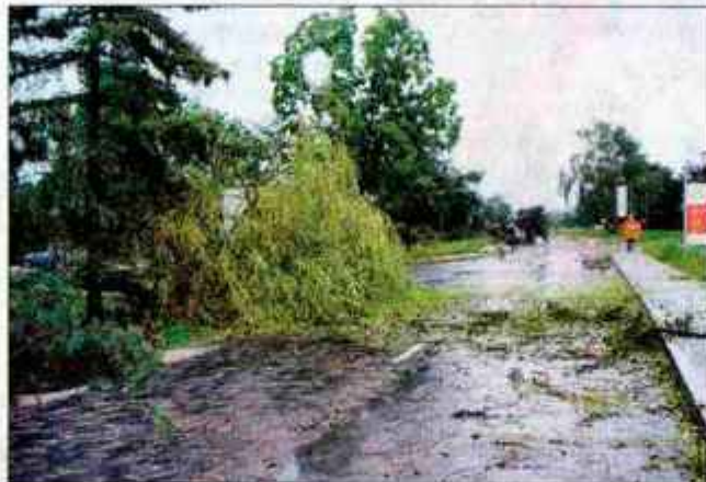
Močan veter je podrl drevesa na Duplici pri Jati.

Kamnik - V soboto nekaj po peti uri popoldne je zahodni del Kamnika zajelo neurje. Na Duplici pri Jati je orkanski veter podrl na cesto od krožišča proti kamniški obvoznici 18 dreves, eno drevo pa je na Kovinarski ulici pri Kamniku, blizu Svilanita, padlo na stanovanjsko hišo in poškodovalo streho. Takoj po neurju so podrti drevesa na Duplici in s strehe stanovanjske hiše odstranili kamniški gasilci. A. Ž.