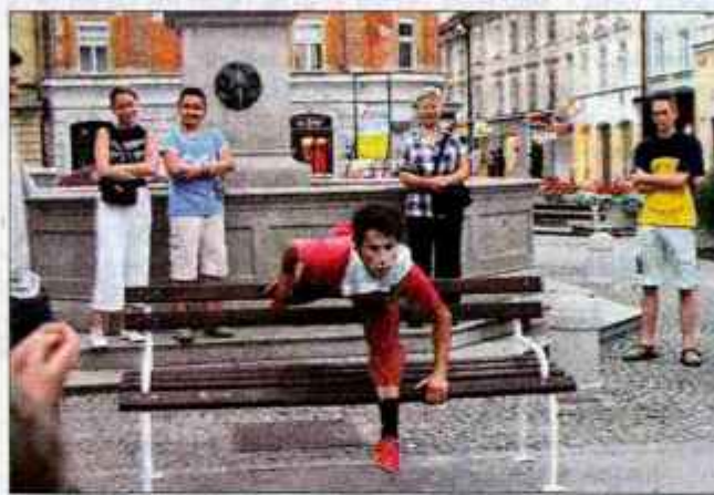
Vodnjak je prostorsko središče Glavnega trga, na katerem se odvija tudi večina kranjskih prireditev.