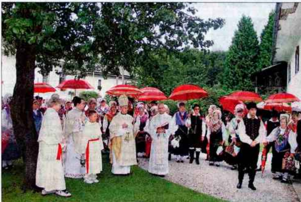
Nedeljska slovesnost v Mošnjah.