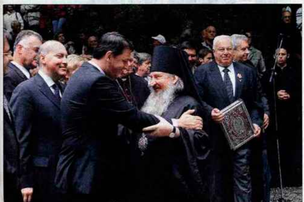
Predsednik vlade Anton Rop pozdravlja goste iz Ruske federacije.

Spomin na ruske vojne ujetnike, ki jih je v zimi 1915-1916 med prisilnim delom na Vrški cesti zasul plaz, v nedeljo počastili politiki z ruske in slovenske strani ter gospodarstveniki, zlasti iz podjetij, ki so poslovno povezana z Rusijo.