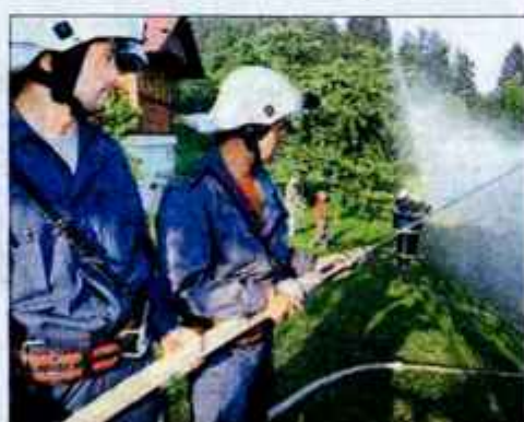
Ob odprtju povezovalnega vodovoda so gorjanski gasilci prikazali gasilsko vajo.

Infrastruktura Bled je spomladi začela graditi nov povezovalni vodovod, ki je razbremenil obstoječega in omogoča pretok večjih količin vode, dela pa so končali konec junija. Vodovod je speljan od državne ceste Gorje-Pokljuka prek polja v Krnici, mimo naselja Postojna v vasi Krnica do Zaboršta, kjer je priključen na obstoječi vodovod, ki poteka iz naselja Zabrežno. "Poleg vodovoda Zaboršt-Zatrata so obnovili tudi vodovod proti lovskim blokom v zgornjem