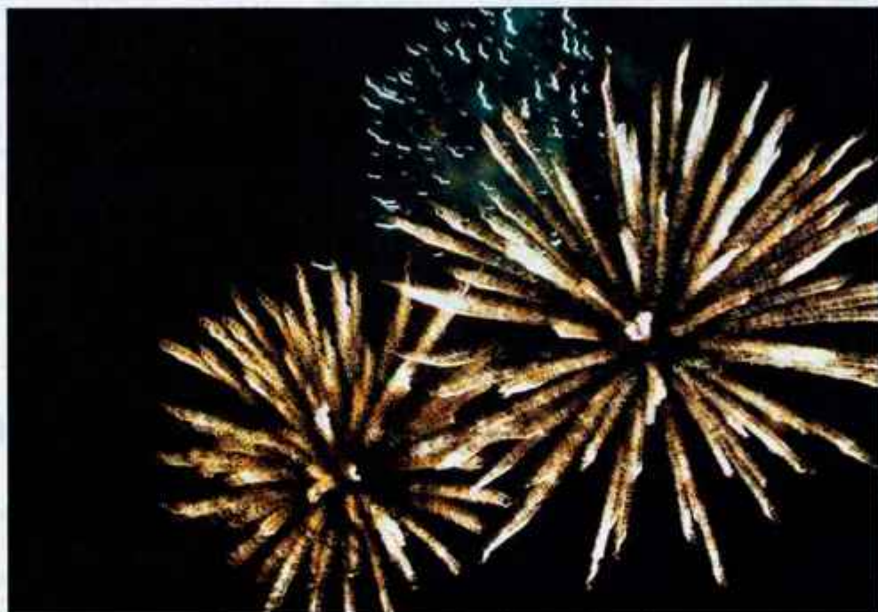
Kranj bo konec julija s festivalom KranFest zasijal v vsem svojem sijaju.

V okviru KranFesta 2004 bomo lahko spremljali srečanje komedij amaterskih gledališč Slovenije in deželo Buc Buc z animacijskimi predstavami za najmlajše ter kreativne delavnice za otroke. Na prireditvi se odvija tudi mednarodni KranFest, kjer se z besedo, sliko in svojim programom predstavljajo države z vseh kontinentov. KranFest 2004 bo ponudil tudi športne prireditve, med katerimi bo tudi letos tekmovanje državnega prvenstva v odbojki na mivki pa tudi drugi športni