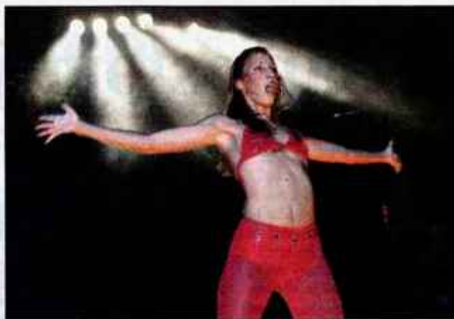
... kot tudi tistim malo manj mladim.

se kmalu pokaže, kdo je s kom v sorodstveni povezavi in kako se te povezave med seboj prepletajo.