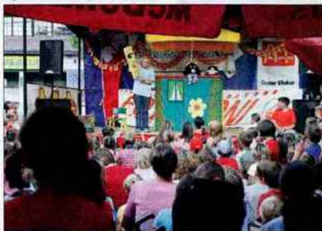
Program KranFesta bo namenjen tako mlajšim obiskovalcem ...

V sredo, 28. julija, bosta na sporedu predstavi Županjin Miško v izvedbi KUD Dolsko z gledališko skupino Od daleč lepši in komedija Godni za poroko, DPD Svoboda s skupino AKSA Javornik s Koroške Bele. Komedija Županjin Miško govori o svetu, ki ga upravljajo ženske. Svet spolnih fantazij. Svet, v katerem gredo ženske dlje od naše fantazije. Svet, kjer nič več ni, kot se zdi. Komedija Godni za poroko pa pripoveduje zgodbo večjega slovenskega mesta, kjer počasi izginja srednji sloj prebivalstva. Ker pa je svet poln zmešnjav,