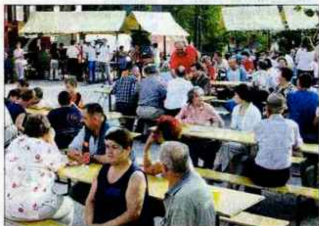
Prireditveni prostor pred kulturnim domom je bil skoraj premajhen za vse, ki so se udeležili slovesnosti ob 750-letnici Bohinjske Bele.