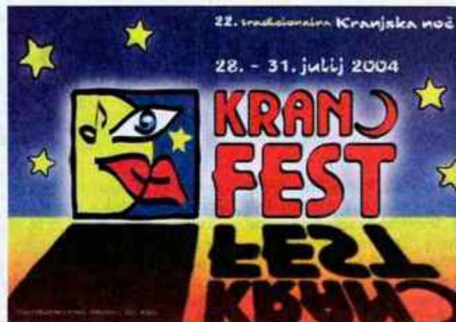
Kranjska noč bo pod okriljem festivala KranFest letos potekala že 22. leto zapored.

V četrtek, 29. julija, si boste lahko ogledali predstavi Večerja z gospodično Sophie v izvedbi Dramske skupine pri PGD Bohinjska Češnjica, ter Boeing - Boeing Kulturnega društva Sv. Anton na Pohorju. V predstavi Večerja z gospodično Sophie butler streže priletni gospodični, ki misli, da večerja s štirimi gospodi, ki pa so sicer že vsi mrtvi. Seve-