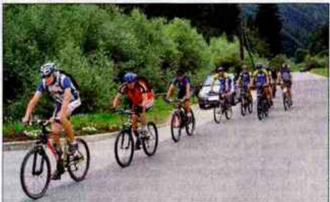
Prvi kolesarji, ki so se podali na prvo in drugo pot, so bili po vrnitvi navdušeni.