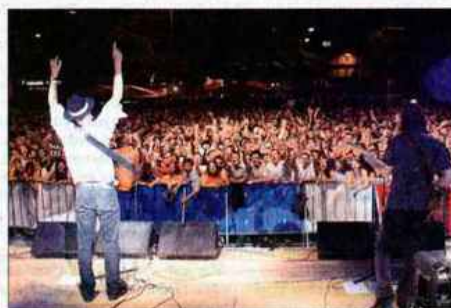
Zvrstili se bodo številni koncerti popularnih izvajalcev.

Parkirišča Obiskovalce naprošamo, da pridejo na prireditev pravočasno in parkirajo svoja vozila na obstoječih javnih parkiriščih in naj upoštevajo navodila rediteljev. Možnost parkiranja je tudi na parkirišču pri Fakulteti za organizacijske vede in pri centru Supermova na Savskem otoku. Obiskovalci parkirajo vozila na lastno odgovornost. Vse, ki vstopajo na zaprta območja, naprošamo, da prevoze opravijo pred pričetkom zapor in da upoštevajo navodila redarjev. Za vse druge informacije se obrnite na Infotočko na Glavnem trgu v času prireditve od 16. ure dalje.