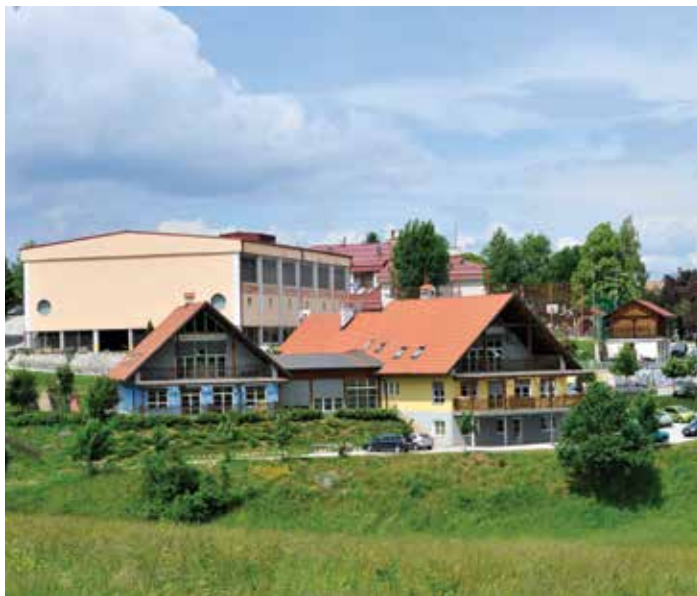
Vrtec Sončni žarek, enota Velike Lašče s športno dvorano v ozadju

Občina Velike Lašče v skladu s Statutom zagotavlja izvajanje javne službe za dejavnosti osnovnošolskega izobraževanja ter predšolske vzgoje in varstva otrok. Kot ustanoviteljica vzgojnoizobraževalnega zavoda Osnovne šole Primoža Trubarja Velike Lašče z vrtcem Sončni žarek zagotavlja pogoje za njegovo delovanje. V skladu z veljavno zakonodajo je občina dolžna zagotavljati sredstva za izvajanje teh dejavnosti, hkrati pa v okviru finančnih možnosti omogoča tudi izvajanje nadstandardnih programov.