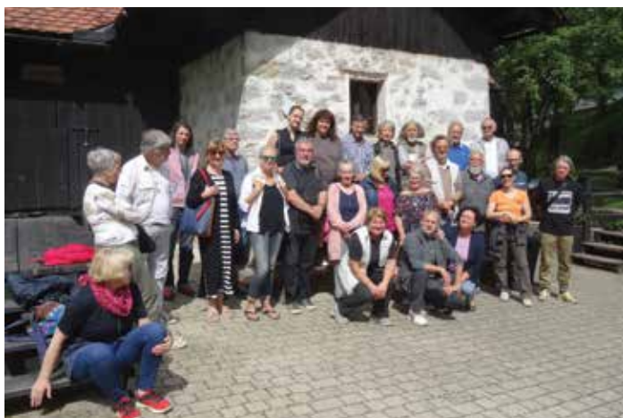
Počakaj, saj še nismo vsi!