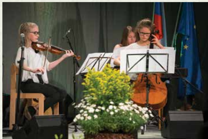
Klavirski trio Glasbene šole Ribnica, oddelka Velike Lašče