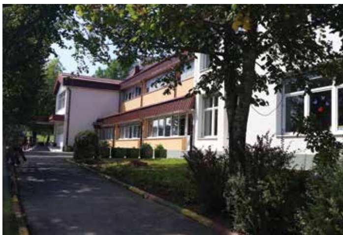
Osnovna šola Primoža Trubarja Velike Lašče

Na podlagi akta o ustanovitvi in področne zakonodaje mora občina iz svojega proračuna financirati dejavnosti predšolske vzgoje v vrtcu Sončni žarek. Pri tem gre za investicije, dodatne dejavnosti in naloge (npr. otroci s posebnimi potrebami) ter doplačila programov k ceni vzgojno-varstvenih storitev. Občina financira razliko med ceno programov in plačili staršev, financira poletne rezervacije in pokriva razliko med dejanskim številom otrok v oddelku in normativom. Poleg obveznih nalog občina izvaja tudi nadstandardne programe, saj financira eno predstavo v tednu otroka in plavalni tečaj za vse otroke vrtca Sončni žarek.