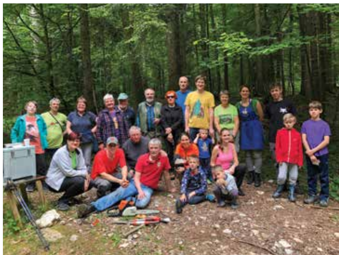
Prostovoljci čistilne akcije

Del ostalin rimskih zapornih zidov se namreč nahaja v dolini Kobiljega curka pri Robu in so zajete v tematsko pot Claustra, s katero upravlja društvo Claustra Alpium Iuliarum iz Velikih Lašč, ter v Geološko pot v Kobilji curek, s katero upravlja Zavod Parnas. Pri projektu CLAUSTRA+ gre za čezmejno destinacijo kulturnega in zelenega turizma Claustra Alpium Iuliarum, ki je sofinanciran s sredstvi Evropske unije (ESRR) v okviru Programa Interreg V-A Slovenija-Hrvaška.