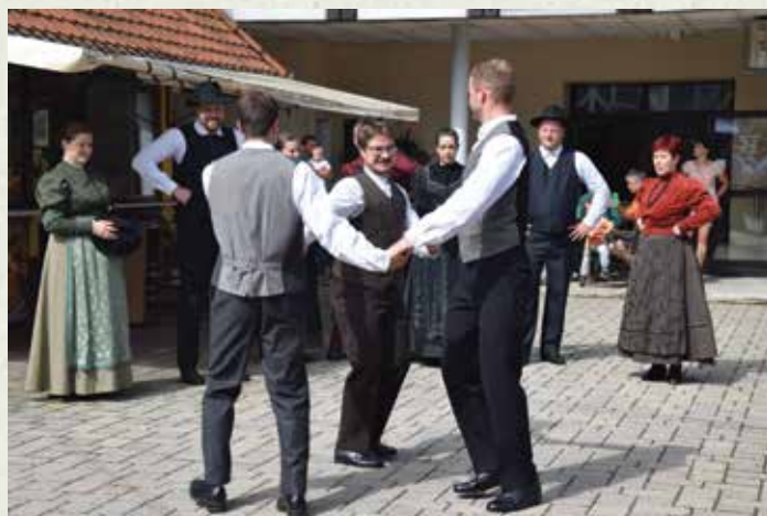
Folklorna skupina Društva podeželske mladine Velike Lašče