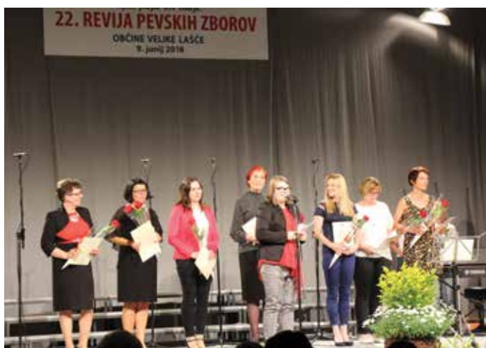
Predsednica in zborovodkinje

Z večkratnim vztrajnim ponavljanjem teh vrednot pridobivamo na prepotrebni samozavesti in krepimo identiteto. Skupna preteklost nas povezuje in nas uči spoštovanja domoljubja.