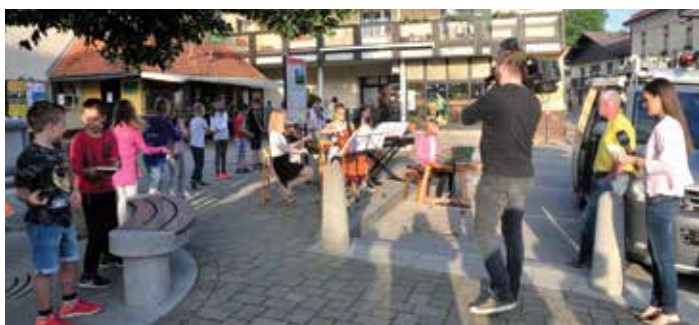
Živa veriga otrok, ki polni s knjigami Bralnico pod lipo ob spremljavi tria GŠ Ribnica