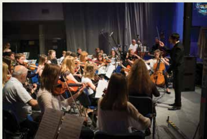
Simfonični orkester Glasbene šole Ribnica