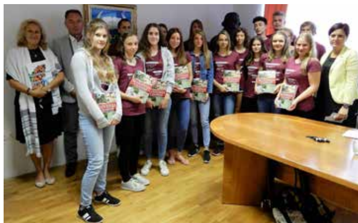
Nika Perovšek, občinska uprava

Iskrene čestitke odličnim devetošolcem, prejemnikom priznanj in vsem učencem, ki so letos uspešno zaključili šolanje na Osnovni šoli Primoža Trubarja Velike Lašče.