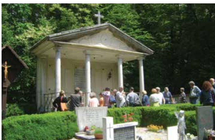
Grobnica grofov Auerspergov na turjaškem pokopališču