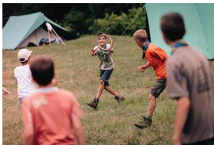
Požrtvovalna žirafa-Petra

Po zajtrku in telovadbi smo se po starostnih skupinah pripravljali na obljube. Vsaka veja je medse sprejela nove člane, ki so bili pri skavtih prvo leto ali pa so odšli k starejšim. Napočil je čas svete maše in obljub. Po sprejemu novih članov smo se skupaj s starši družili do popoldneva. Stegov vikend zaključek skavtskega leta bo zagotovo vsem ostal v lepem spominu, predvsem pa tistim, ki so letos obljubili in postali člani naše skavtske družine. Že sedaj se veselimo vseh pogumnih otrok, ki se nam bodo naslednje leto upali in želeli pridružiti.