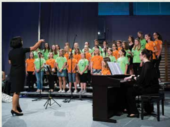
Mešani pevski zbor OŠ Primoža Trubarja Velike Lašče