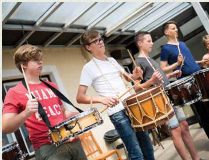
Bobnarska skupina KUD Primož Trubar Velike Lašče