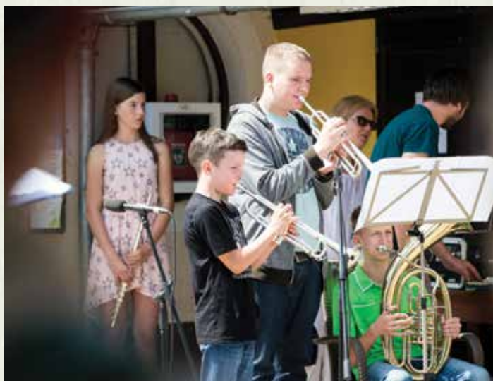
Nastop učencev Glasbene šole Ribnica, oddelka Velike Lašče