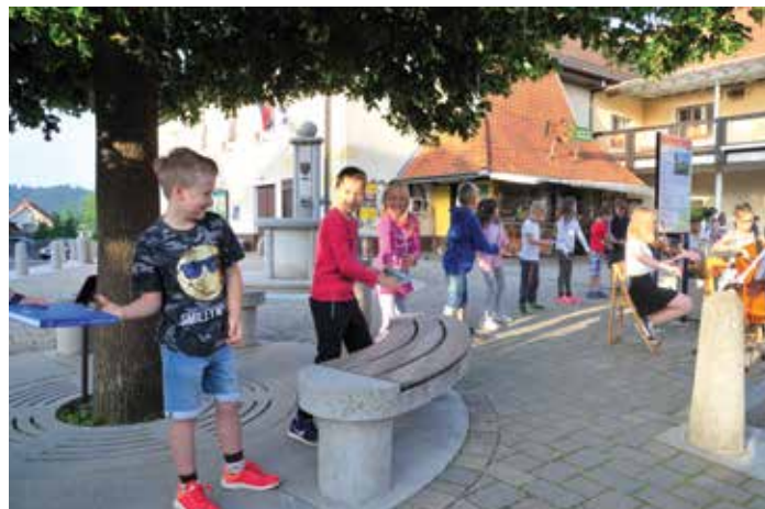
Polnitev Bralnice 1. junija ob snemanju oddaje Dobro jutro

Občina Velike Lašče ga je pridobila lanskega decembra za obdobje treh let. Tudi v letošnjem letu je odprt razpis, osrednja podelitev certifikatov pa bo letos 3. decembra na Ta veseli dan kulture ravno v Levstikovem domu v Velikih Laščah.