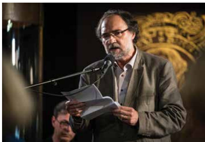
Boris A. Novak

Objavil je 90 knjig, njegova dela so v 20 knjigah izšla v številnih tujih jezikih. Unikum v svetovnem merilu so pesmarice pesniških oblik ( Oblike sveta , Oblike srca in Oblike duha ), v katerih je na 500 straneh predstavil 220 pesniških oblik. Med svetovne dosežke sodi tudi njegov ep Vrata nepovrata (več kot 40.000 verzov na 2.300 straneh) v treh knjigah: Zemljevidi domotožja , Čas očetov in Bivališča duš , Zanje je prejel več nagrad: Župančičevo nagrado za Zemljevide domotožja , nagrado deklica s piščalko za Čas očetov ter za celoten ep veliko nagrado Slovenskega knjižnega sejma za knjigo leta 2017 in Veronikino nagrado za najboljšo pesniško zbirko leta 2017 . Ep je zgodbovinopisje (Novakova »skovanka«), apokaliptično videnje Slovenije in sveta, z vso tragiko in veseljem. V njem uveljavlja svoje načelo, naj »zven pomeni in pomen zvenik«, kar smo slišali tudi v odlomku iz Zemljevidov domotožja (1. zvezek: Nagovor , 2. spev: Rodovnik ), ki ga je prebral avtor in v katerem se skozi podobe prednikov pomenljivo sprašuje, kdo sploh je.