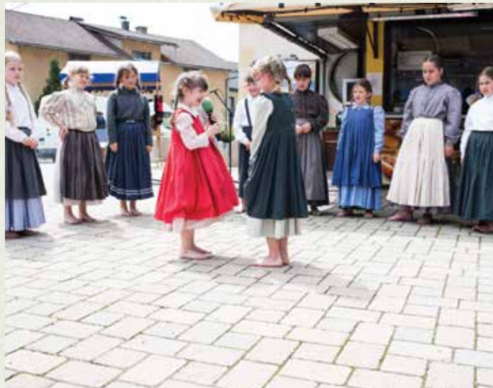
Otroška folklorna skupina Moravče