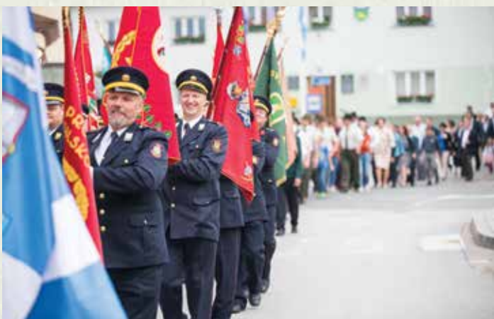
Spreved izpred občinske stavbe