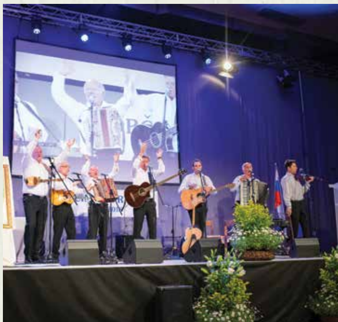
Koncert Prifarskih muzikantov

V sklepnem delu prireditve je sledil koncert Prifarskih muzikantov, ki so poskrbeli za veselo vzdušje v dvorani in prijeten zaključek.