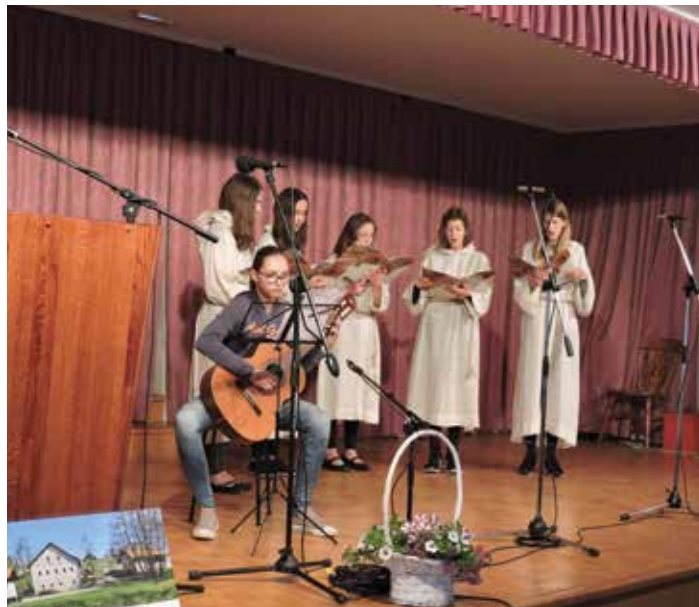
Nastop učenk osnovne šole na prireditvi v Petanjcih, 2017

Občina je tudi pokrovitelj mnogih dodatnih aktivnosti med šolskim letom. Sem spadajo sofinanciranje decembrskega dobrodelnega koncerta, ki ga organizira osnovna šola, letošnjega dobrodelnega teka Hočem, zmorem, tečem! in nakupov majic za posebne priložnosti (za prvošolce, devetošolce, državne prve v igri med dvema ognjema).