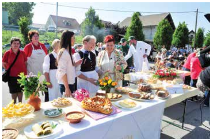
Predstavitve Društva podeželskih žena Velike Lašče

V osrednjem delu se je dogajanje preselilo na parkirišče pod kmetijsko zadrugo, kjer so se v zelo lepem številu predstavila različna društva, zavodi, ustanove in posamezniki, ki delujejo v Velikih Laščah.