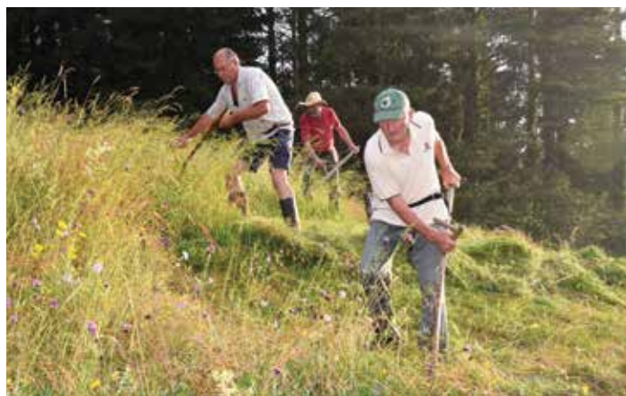
Kosci in grabljice 13. košnje Korovega hriba v Robu