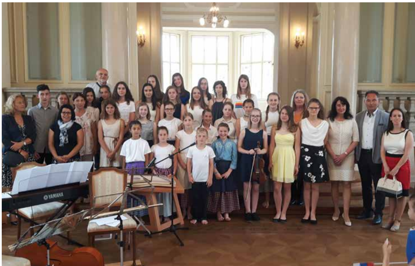
Obisk predsedniške palače, 2018