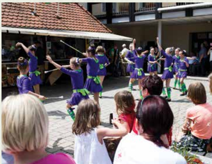
Mažoretna skupina KUD Primož Trubar Velike Lašče