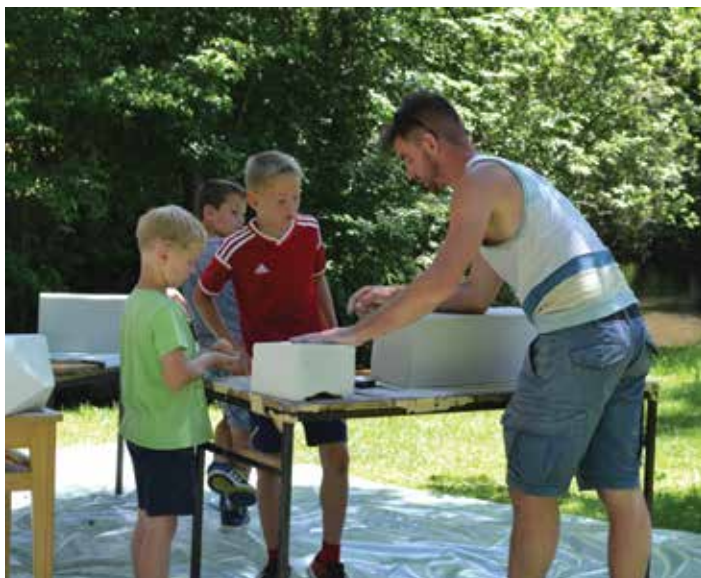
Nedeljsko popoldne na Trubarjevi domačiji kot zaključek prireditev ob občinskem prazniku 2017