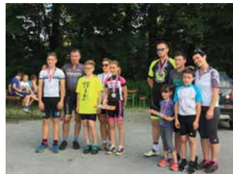
Dve družini sta tekmovali s po 5 člani