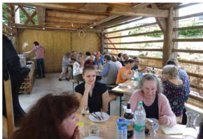
Na koncu pa pod kozolec na Kukmako!