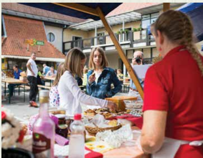
Društvo podeželskih žena Velike Lašče z degustacijo domačih dobrot