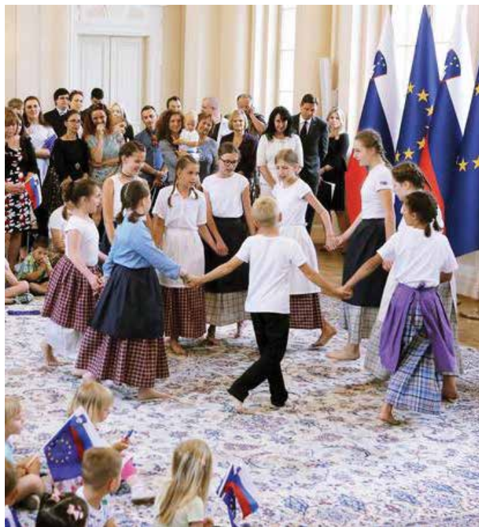
Nastop učencev OŠ Primoža Trubarja in GŠ Ribnica, oddelka Velike Lašče v predsedniški palači, 2018

Dodatna sredstva prejme javni zavod tudi na podlagi prijave na vsakoletni razpis za sofinanciranje prireditev in programov na področju ljubiteljskih kulturnih dejavnosti v občini, kjer običajno uveljavljajo refundacijo stroškov za prireditve ob prvem šolskem dnevu in ob zaključku šolskega leta.