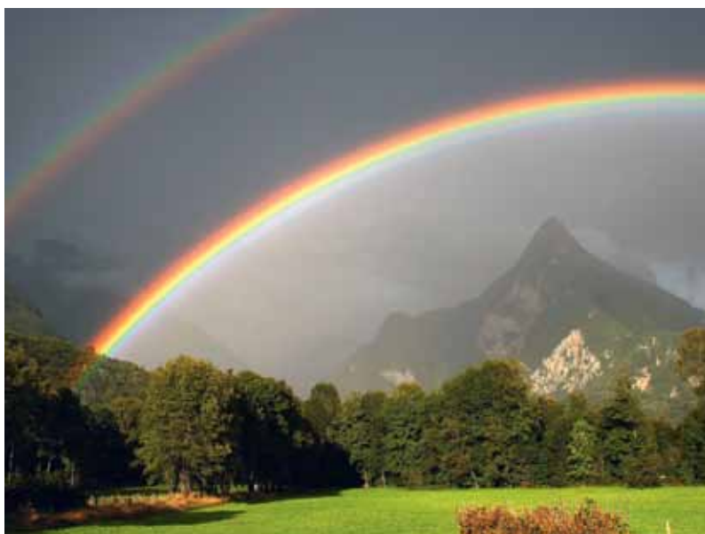
Mavrica nad Svinjakom