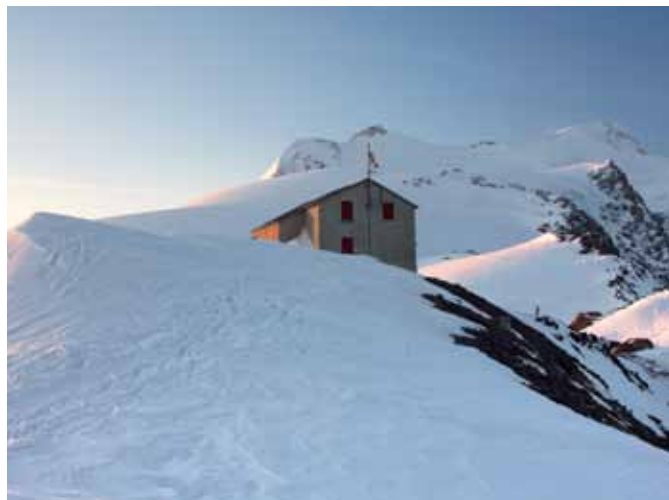
Monte Cevedale s kočje Casati

Cevedale je znan kot lažji turnosmučarski vrh. Nanj lahko pristopimo zahodno iz doline Valle di Cedec ali pa s severa iz doline Martelltal, kar je opisano tu. Celotno turo močno skrajšamo, če uporabimo žičnico. Z vrha Cevedala je najboljši pogled na vzhodno pobočje markantne sosednje gore Gran Zebrù/Königspitze.