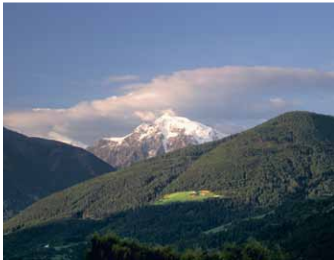
Ortler s severa

radi jeze na pritlikavca iz Stilfsa spremenil v kup ledu in kamenja. Nanjo so prvič pristopili Josef Pichler, Johann Leitner in Johann Klausner leta 1804, Pichler pa je leta 1805 s tremi tovariši preplezal Hintergrat (vzhodni greben) in na vrhu prižgal luč, da so jo videli v dolino. Z njegovega vrha je strašljiv pogled na severno steno sosednjega vrha Gran Zebrù (Königspitze).