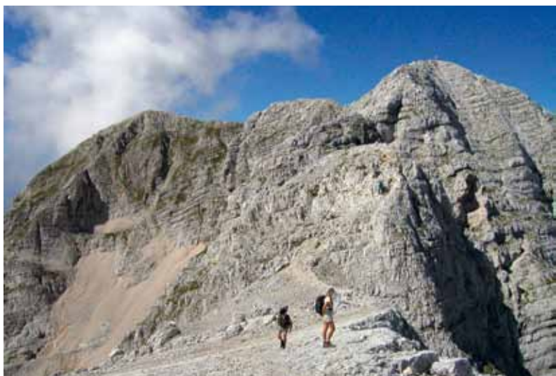
Visoki Kanin