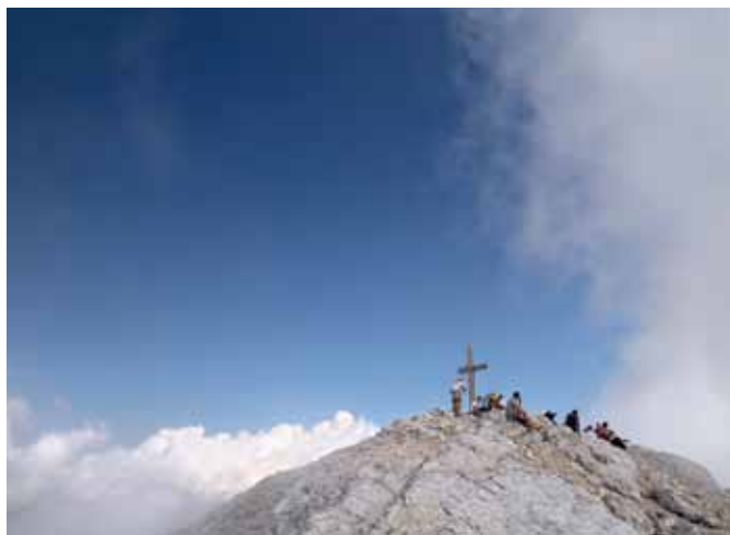
Vrh Visokega Kanina

Bovca je najkrajša in najlažja, vseeno pa je ne smemo podcenjevati, saj je greben zahteven, prav tako pa se gibljemo v čisto pravem visokogorju. Z vrha Kanina je čudovit razgled na Jadransko morje, Zahodne Julijce in ostale visoke vrhove Julijskih Alp. Ob lepi vidljivosti seže pogled vse do Dolomitov.