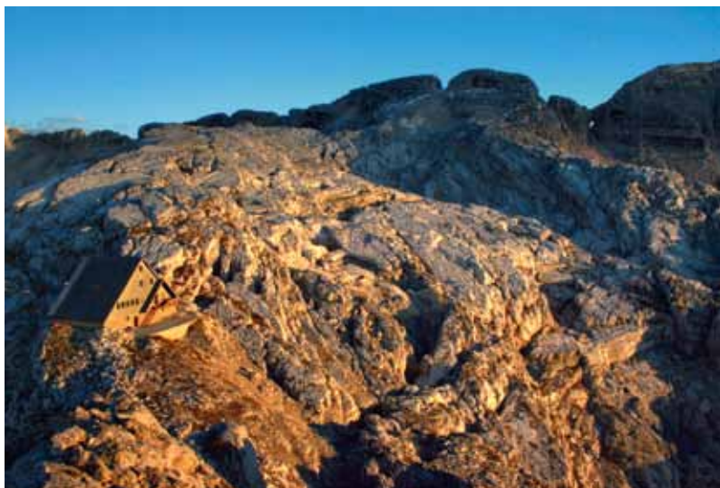
Dom Petra Skalarja in Prestreljeniško okno

Zemljevidi: Bovec z okolico, 1 : 25.000; Bovec, 1 : 40.000; Triglavski narodni park, 1 : 50.000; Julijske Alpe, zahodni del, 1 : 50.000.