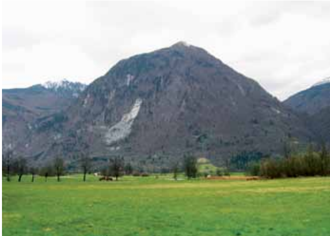
Javoršek iz Bovške kotline

Zemljevidi: Bovec z okolico, 1 : 25.000; Bovec, 1 : 40.000; Triglavski narodni park, 1 : 50.000; Julijske Alpe, zahodni del, 1 : 50.000.