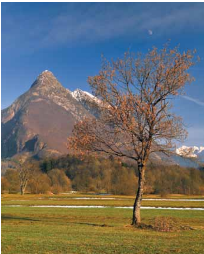
Svinjak - Bovški Matterhorn

Svinjak imenujejo domačini kar Bovški Matterhorn. Resnično spominja na znano švicarsko goro, saj je iz Bovca videti strm in markanten. Svinjak je zadnji vrh v grebenu do Bavškega Grintavca. Ponuja čudovit pogled nad Bovško kotlino ter na vse bližnje