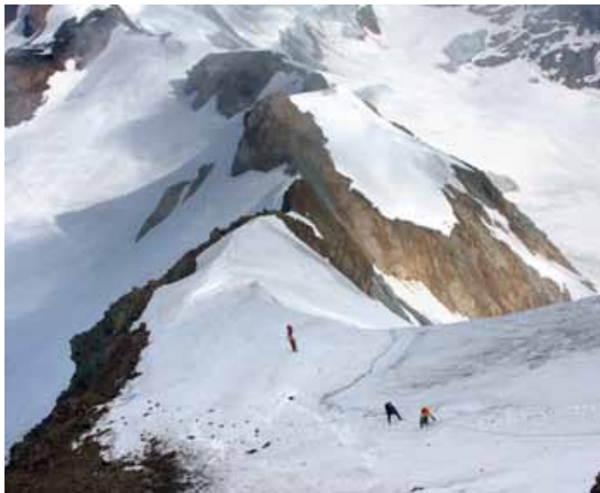
Vršni del vzpona na Punta San Matteo

leži Ghiacciaio di Dosegù in na jugovzhodni strani manjši ledenik Vedretta di Monte Giumella. Med prvo svetovno vojno se je na njem odvijala ena zadnjih bitk v letu 1918 med Italijo in Avstro-Ogrsko, zato je do leta 1999 veljala za najvišje bojišče.