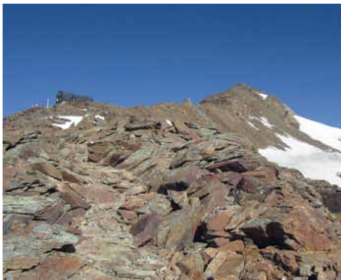
Koča Mantova in Monte Vióz

skalna, pod vrhom stoji nova manjša koča Rifugio Mantova al Vióz. Gora je imeniten razglednik, saj se vidijo Monte Cevedale, Königspitze in ledene širjave na severu, na jugu pa Cima Presanella, Adamello in Brenta.