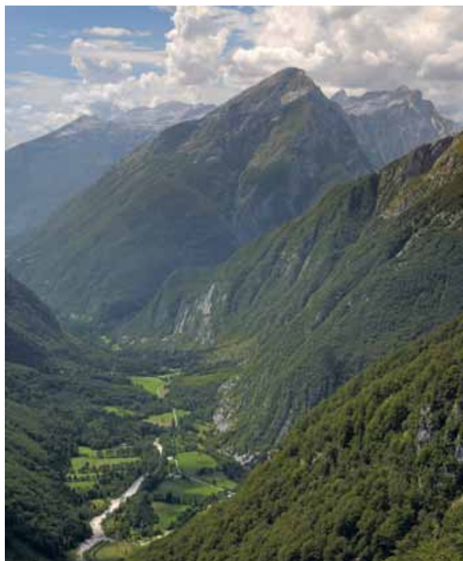
Rombon s pobočij nad Bavšico

Rombon je prostrana gora nad Bovcem z lepim razgledom povsem na vzhodu Kaninske skupine. Gora ima žalostno zgodovino, saj je bilo tukaj eno od središč bojevanja med Avstrijci in Italijani, tako da lahko med vzponom opazimo mnoge ostanke tedanjega časa. Na Rombon vodijo tri poti. Najlažja,