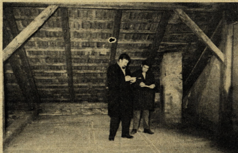
Podstrešje pred adaptacijo