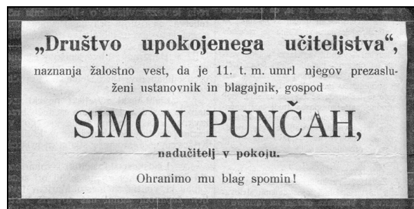
Osmrtnica, ki jo je društvo objavilo 14. julija 1921 v Učiteljskem tovarišu (UT, 14. 7. 1921, str. 4).

Oktober 1921 so poročila o učiteljskih upokojencih v Učiteljskem tovarišu pričela izhajati v posebni rubriki Vestnik učiteljev upokojencev. V prvi taki rubriki je spet poročilo o draginji, ki upokojence najbolj prizadene. Primerja dohodke družin z enakih številom članov, ena je učiteljeva, ki je učil 40 let, druga železničarja – "lampista", ki služi deset let. Prvi dobiva približno 2000 kron, drugi čez tri tisoč. V dopisu pozivajo vlado, naj končno kaj stori, kajti učiteljstvo "trpi veliko bedo, strada, hodi v ponošeni in razcapani obleki..." 60