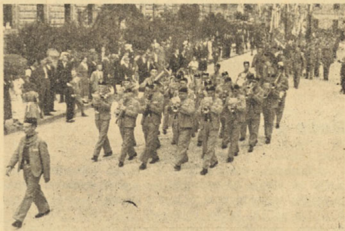
Sokolska godba Trbovlje v povorki na župnem zletu

Trboveljska sokolska godba je nadalje sodelovala pri treh zadnjih župnih zletih (glej sliko!), pohitela na pokrajinski zlet v