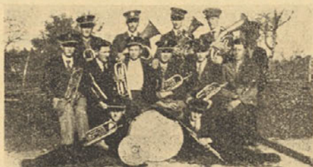
Sokolska godba Artiče

Najboljša naša godba, znana tudi izven mej naše župe, je vsekakor godba trboveljskega Sokola, ki je bila ustanovljena na pobudo br. Dolničarja in z izdatno podporo oz. dolgoročnim posojilom bratskega Saveza. 1. decembra 1933 je sokolska godba prvič igrala v povorki. Od tedaj se pa je leto za letom izpopolnjevala in sodelovala na nastopih mnogih sokolskih društev. Tako je igrala že v Brežicah, Sevnici, Radečah, Laškem, Sv. Petru v Sav. dolini, Žalcu, Sv. Pavlu pri Preboldu, na Vranskem, v Motniku, Mozirju, Hrastniku, na Dolu pri Hrastniku, v Zagorju, Polšniku, Ponovičah, Litiji, Šmartnem pri Litiji in Dolenjem Logatcu.