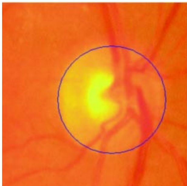
Sl. 1. Avtomatska določitev papile vidnega živca.

Figure 1. Automatic determination of optic disc.