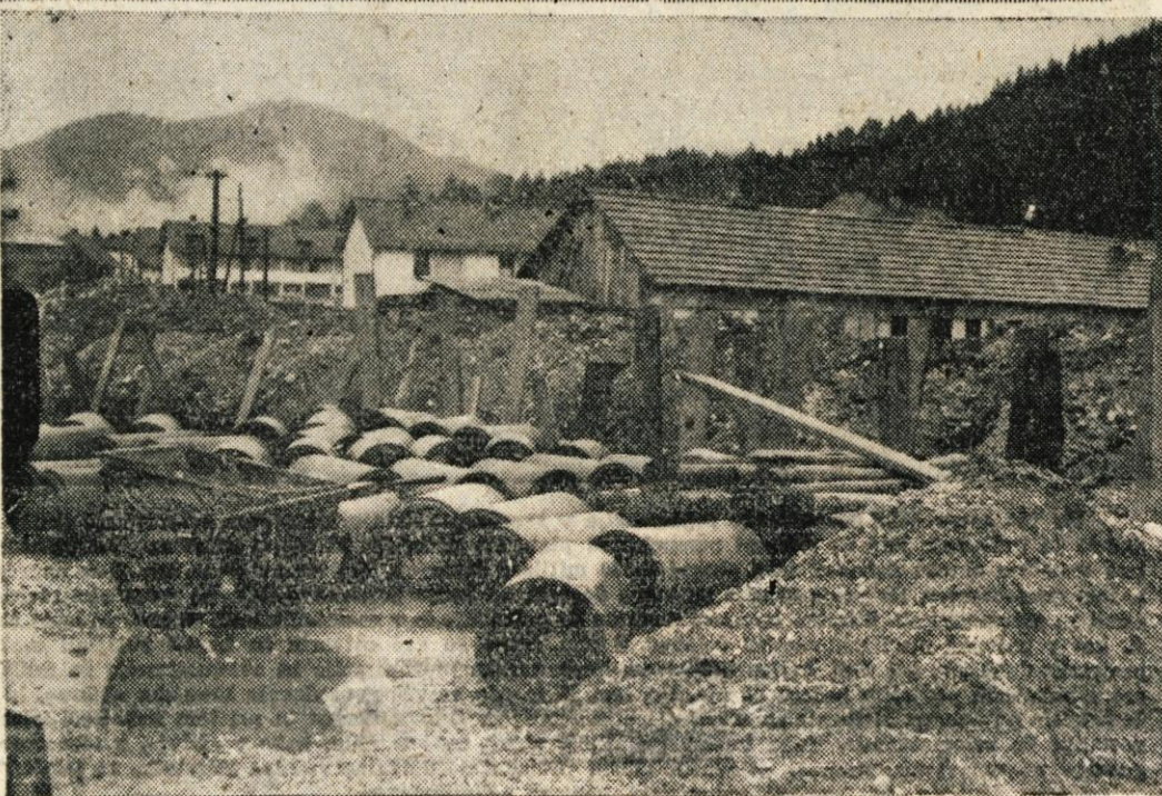
Preskrba z živili je v Stražišču že nekaj let morda najbolj pereč problem. Pred kratkim pa se je to vprašanje končno le premaknilo z mrtve točke, kot pravimo. Slika prikazuje začetna dela pri gradnji novega poslopja — potrošniškega servisa

Ob koncu so izvolili še vodstvo Občinskega komiteja ljudske mladine Trzič.