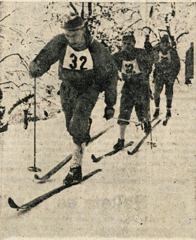
Z lanskoletne prireditve »Po stezah partizanske Jelovice«

Nedavni odlok Okrajnega ljudskega odbora, s katerim je ta prireditve zadobila globlji pomen, široke želje mladine za udeležbo na zimsko-sportnih tekmah, veliki dogodki na Jelovici v okviru naše revolucije in NOB ter končno še 20-letnica vstaje. Vse to daje poseben pečat letošnje pete prireditve »Po stezah partizanske Jelovice«, ki bo v dnevih od 14. do 15. januarja.