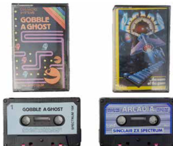
Slika 5: Kaseti

Pri emulaciji prikazovalnih naprav je težje simulirati njihovo notranje stanje, kot je npr. vrstično osveževanje starih zaslonov s katodno cevjo, zato včasih uberemo bližnjice, npr. sliko prikažemo kar na modernem zaslonu. Pri tem pa vseeno lahko emuliramo nekatere ostale značilnosti, kot je npr. svetlost zaslona, imitacija ogrevanja zaslona s katodno cevjo itd.