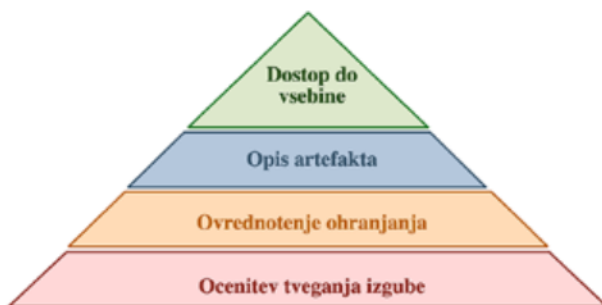
Slika 1: Primer različnih pogledov na digitalni artefakt

Ameriška neprofitna organizacija Online Computer Library Center je leta 2006 definirala strategijo [Online Computer Library Center, 2006] dolgotrajnega ohranjanja digitalnih objektov, ki nudi več od dobrega sistema za varnostno kopiranje. Strategijo grafično ponazorimo s piramidno shemo, predstavljeno na sliki 1.