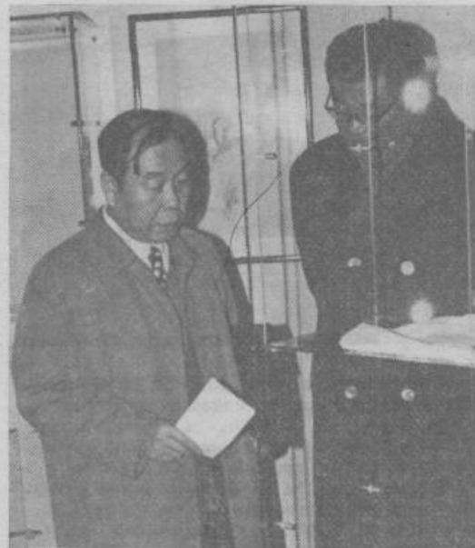
Pri otvoritvi razstave »Kitajske vezenine« v Goričanah so bili prisotni tudi predstavniki kitajskega veleposlaništva v Beogradu.

Sedanja razstava raznovrstnih in izvirnih kitajskih vezenin iz najnovejše preteklosti te dežele v muzeju Goričane pomeni začetek aktivnega sodelovanja Slovenskega etnografskega muzeja s kitajskimi muzeji. To sodelovanje in posredovanje izredno bogate stare in nove kitajske kulture nam bo še bolj približalo še pred nekaj leti neznano Kitajsko.