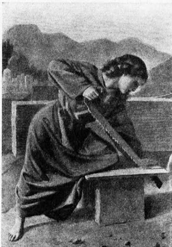
Jezus-mladenič nima počitnic.

Zofka se je pa tudi zahvalila Milki, Lenčki in Metki za vse njihovo prijateljstvo ter odšla k počitku in srce ji je prekipevalo od hvaležnosti in sreče. (Konec.)