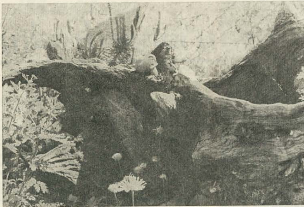
Ena izmed domiselnih olepšav za urejeno okolje