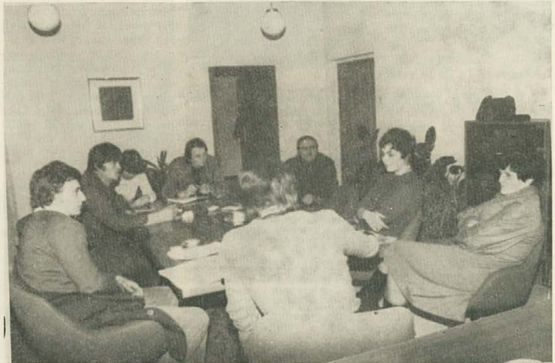
S sestanka KS OO ZSMS