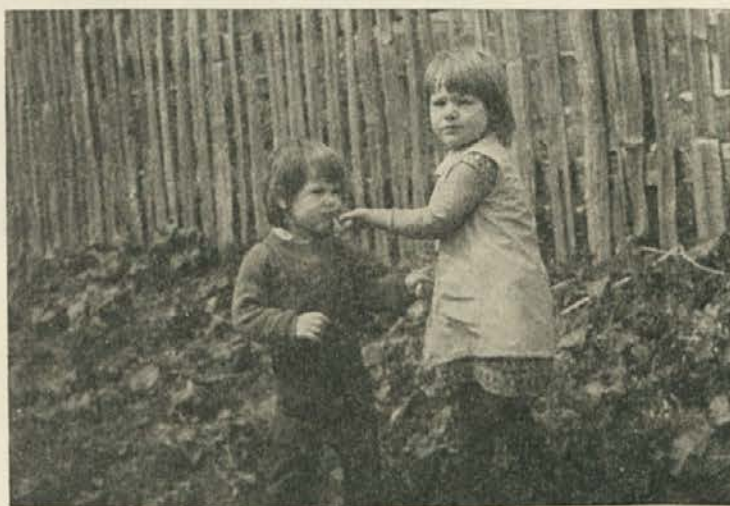
Zdravi otroci so naš ponos