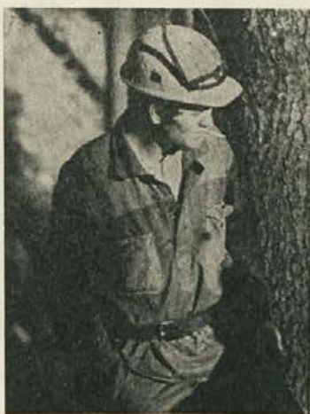
Kratek odmor med delom