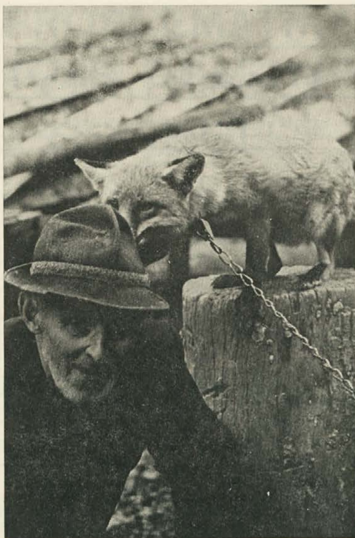
Na Škofovi domačiji v Trbovljah so udomačili mlado lisico. Sožitje izgleda dobro.

Avtor ugotavlja, da je potrebno poleg lupljenja kritično pregledati tudi objedanje pritalne vegetacije. Pravi, da se je na osnovi literature iz