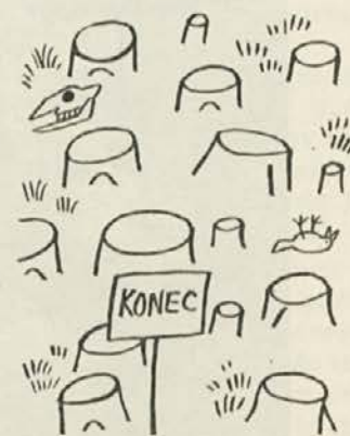
Gozd opazuj in spoznavaj s fotokamero in ne z uničevanjem rastja in vznemirjanjem živali