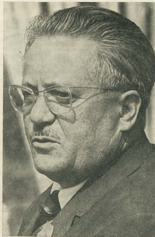
So ljudje, ki s smrtjo ničesar ne izgubijo, postanejo celo več in Edvard KARDELJ je tak človek