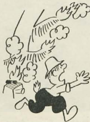
Ne kuri v gozdovih

Že drugi dan je vstala. Treba je bilo oprati plenice, skuhati kosilo, saj so vse te dni, kar je ni bilo, živeli le bolj pri kruhu in mesu in prav željni so bili kaj dobrega. Spravila se je na noge, ki