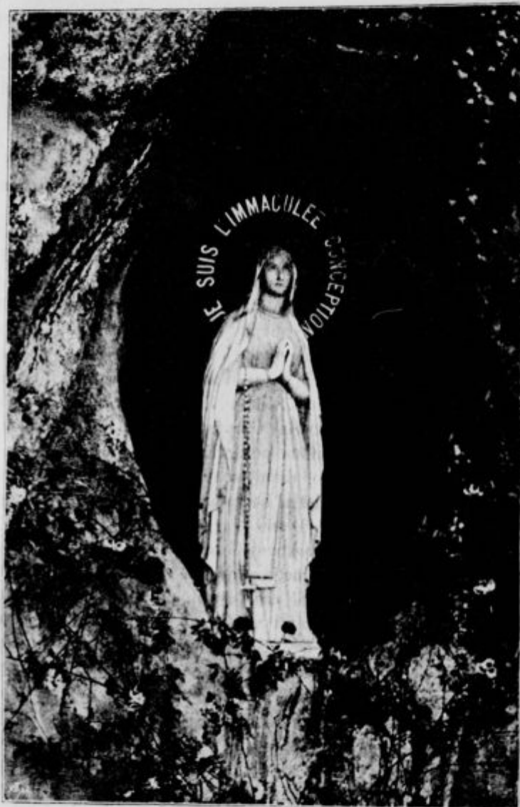
Kip Matere Božje v votlini lurški.

„No, no, kaj pa?“ je začel prav lepo govoriti. „Kaj bom neki napravil?“