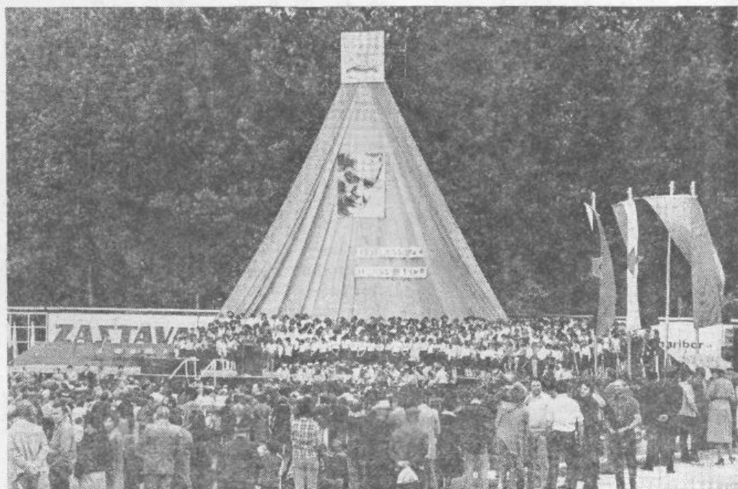
Slavnostno vzdušje na osrednji prireditvi

Ob kulturnih večerih na Trgu prekomorskih brigad je tovarna Rašica pripravila modno revijo svojih ekskluzivnih izdelkov, ki je med številnimi obiskovalci požela obilo pohval.