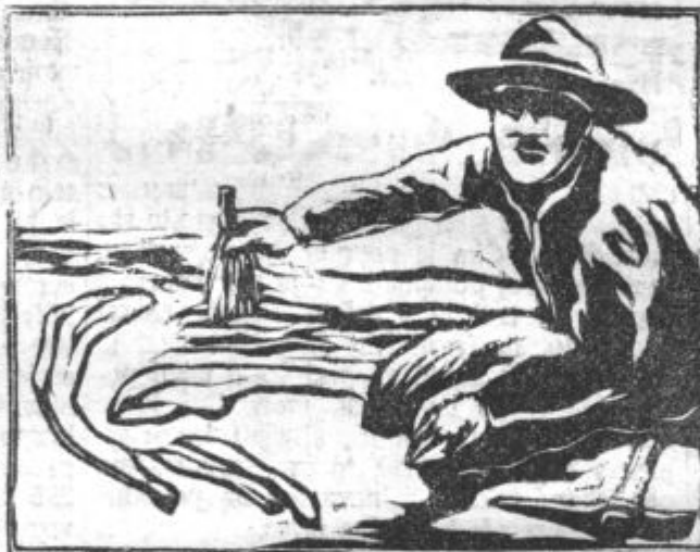
Izkopavanje okostja dinosaurija, ki je za časa svojega življenja bil 25 metrov dolg

V jajcih so se videla okostja dinosaurijevih embrijev, ki so se jasno po beli barvi razločevala od ostale rdeče okamenele snovi. Jajca so ležala samo nekaj centimetrov od ogromnega dinosaurijevega okostja v isti zemeljski plasti. S tem je prvokrat podan znanstveno neoporečni dokaz, da so se te ogromne praživali razplojevale iz jajec. Velikost teh po geološki (zemljelovni) cenitvi okrog 10 milijonov let starih jajec znaša 20 cm pri 15 cm premera. Oblika je enako podolgasta, kakor prevladuje še dandanes pri reptilijah. Lupine so 3 do 4 cm debele. Skupaj z okostji različnih velikosti podajo te najdenine v Mongoliji popolno sliko razvoja dinosaurijev od jajca do doraščenejšega stvora, ki je dolg skoro 25 metrov.