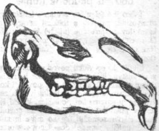
Lobanja baluhiterija, največjega doslej izkopanega sesalca pračasov.

V neki mlajši zemeljski plasti poleg so našli okamenele ostanke živali, ki je bila najbrže predhodnik današnjega nosoroga in kateri so dali ime baluhiterij (baluchitherium). Ta žival, visoka 8 metrov, je največji doslej odkriti sesalec. Starost tega okostja se ceni na 3 milijone let. Uživale pa so te živali le rastlinsko hrano, pri čemer je pač obed, ki je tehtal le nekaj ton, bil neznamenit zakusek. Danes pri današnjem rastlinstvu bi takšne živali ne mogle živeti. Saj je morala ena taka žival obrgosti cele gozdove, da se je nasitila. Najdba tega okostja v Mongoliji pa dokazuje obenem, da so danes tako mrtve puščave notranje Azije morale imeti takrat nad vse bujno rastlinstvo.