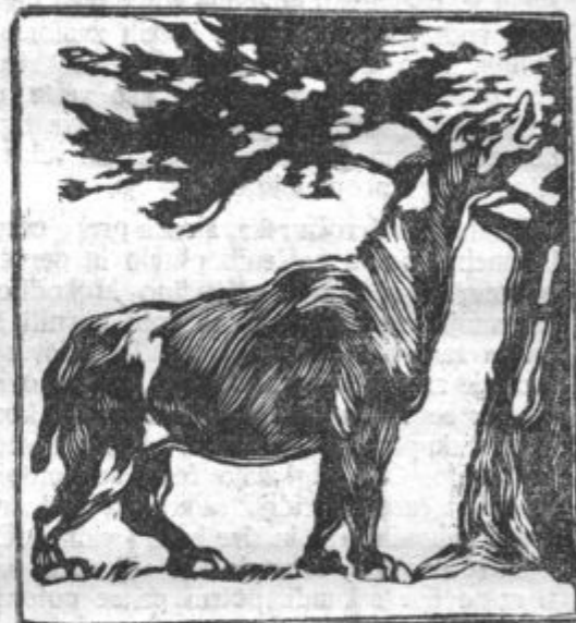
Približno tako obliko telesa je moral imeti 8 metrov visoki baluhiterij.