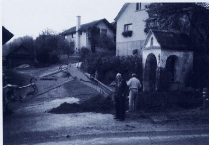
Tudi Rožna ulica je bolje razsvetljena