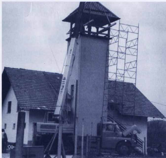
Streha na stolpu je postavljena

Vsem, ki ste darovali za prapor ali kako drugače sodelovali, se iskreno zahvaljujemo.