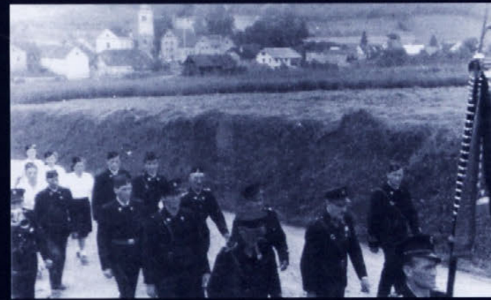
praznik občine Mokronog 1954