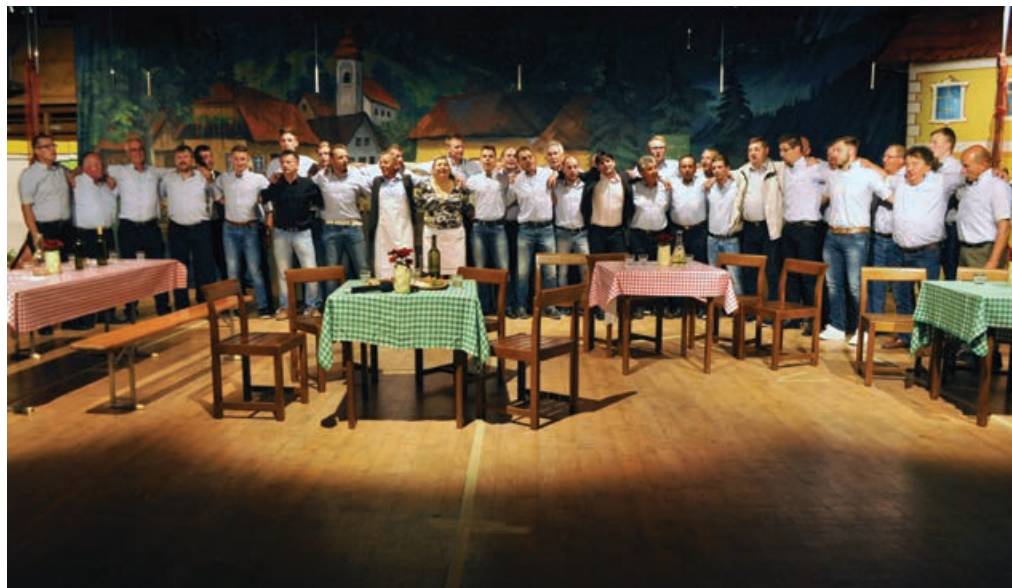
Kulturno društvo "Alojz Štrafela" Markovci – MoPZ.