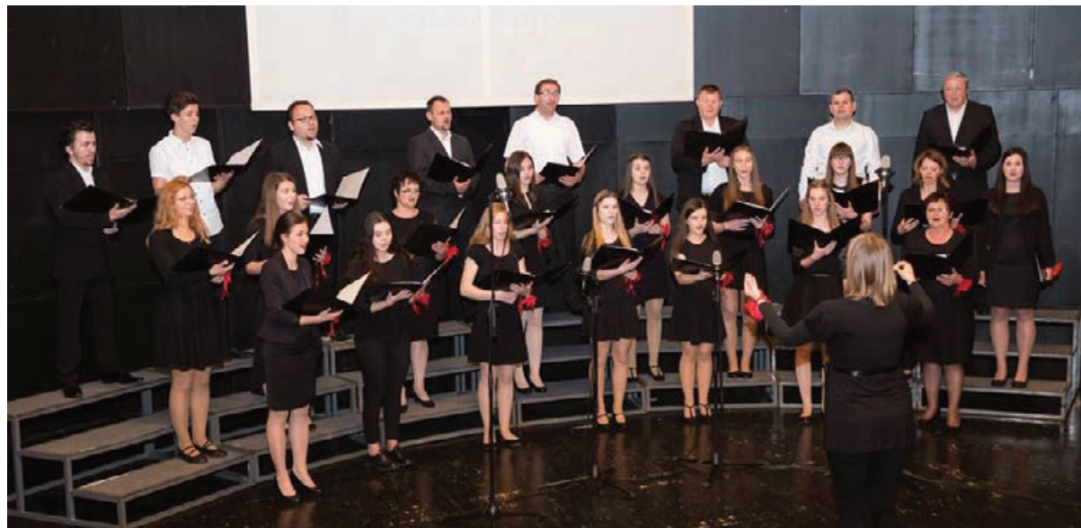
Za MeCePZ je letošnja pomlad bila zelo aktivna.