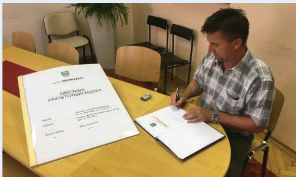
30. junija je bil podpisan težko in dolgo časa pričakovani občinski prostorski načrt.