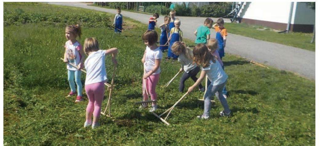
Grabljice na delu