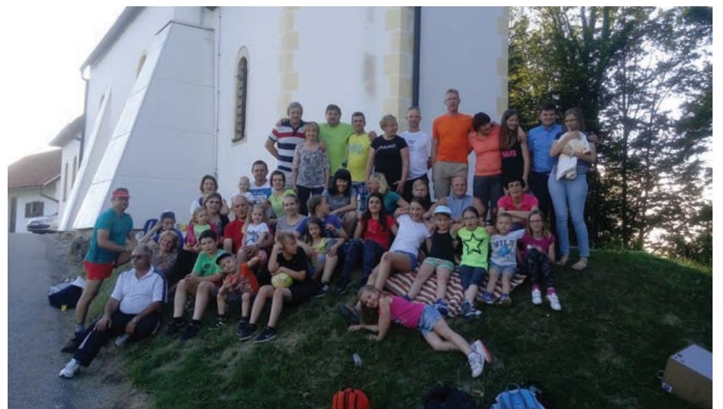
Dve zakonski skupini, ki delujeta v naši župniji, sta mesečna srečanja v letošnjem letu zaključila s pohodom oz. z romanjem k cerkvi sv. Elizabete v Pohorju (župnija Cirkulane). V juliju se nekaj družin odpravljata tudi na romanje v italijanski Assisi.