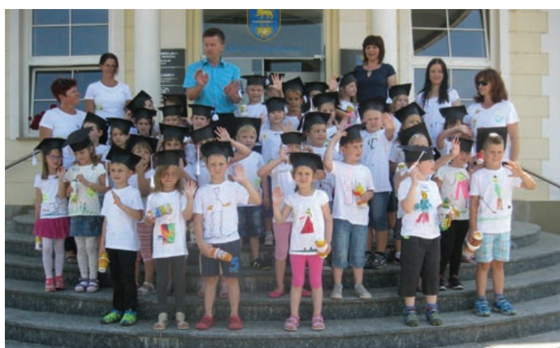
» 1. septembra boste stopili na novo pot ... Naj bo uspešna.«