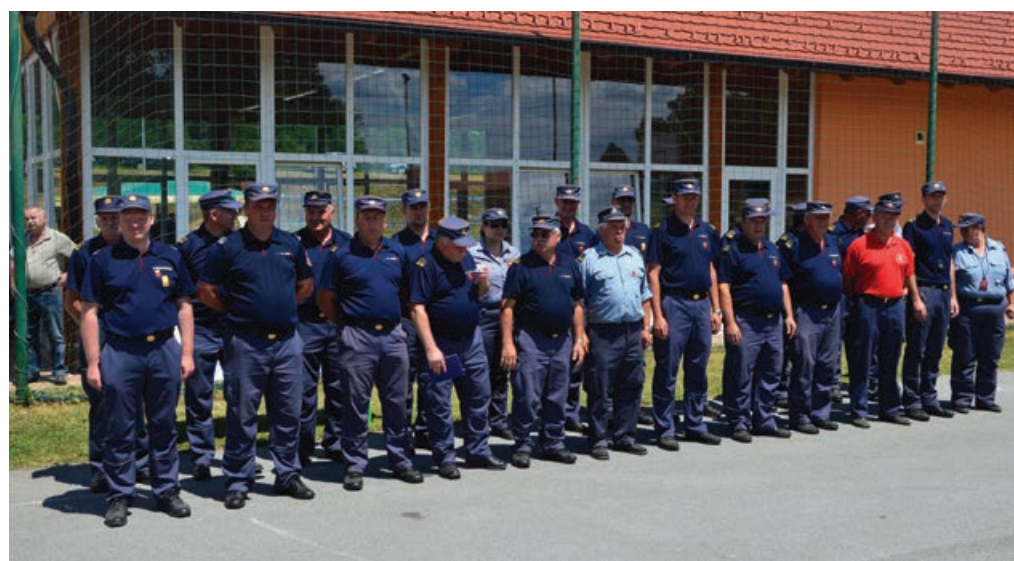
Tekmovalni odbor in ocenjevalne komisije so odlično opravile svoje delo.