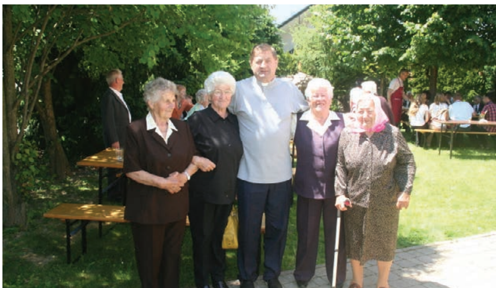
28. maja je nedeljska sveta maša bila darovana za bolne, ostarele in invalide iz naše župnije. Vsakdo je pri maši lahko prejel zakrament bolniškega maziljenja. Da župnija ni pozabila na ostarele župljane, se je nanje spomnila s sveto mašo, po njej pa je sledila zakuska; zadovoljstva na obrazih ni manjkalo. Hvala vsem, ki ste svojim staršem, sorodnikom, sosedom .. omogočili srečanje.