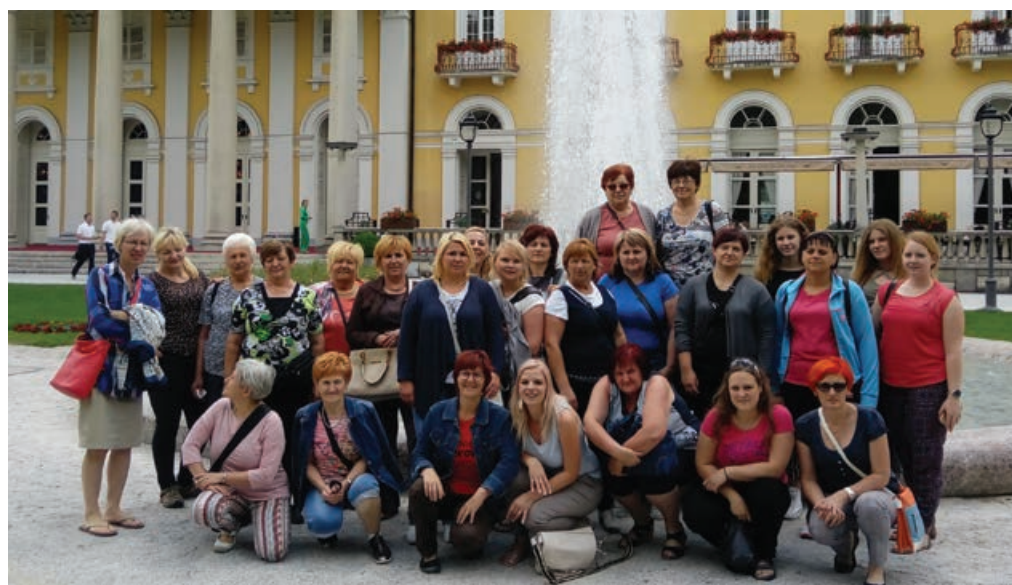
Prostovoljke iz Ptujške Gore in Markovcev v Rogaški Slatini.