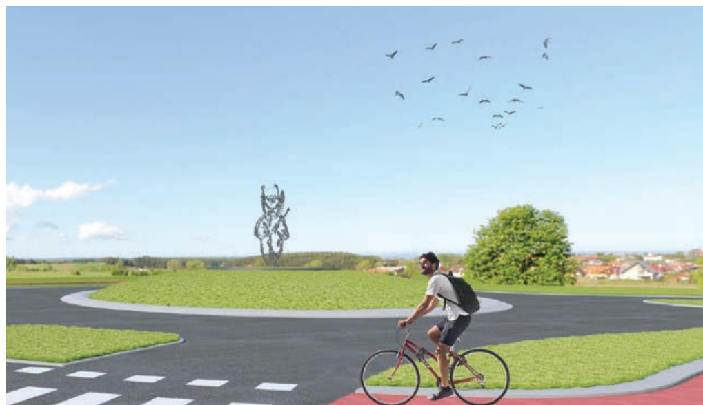
Prikaz umestitve skulpture v središče krožnega križišča pri trgovini Tuš Špic.

2012. Z izgradnjo mostu bi vaščanom naselij Markovci, Zabovci, Nova vas, Spuhlja in tudi širše omogočili prehod oz. prevoznost s kolesi vse do središča Ptuja. V kratkem izgradnje kljub dokaj enostavnemu mostu ni pričakovati, zato bodo tudi naši vaščani enakovredno čakali v prometnih zastojih s preostalim tranzitom.