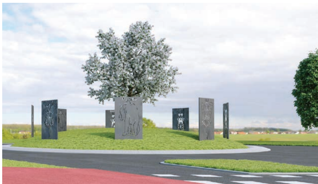
Prikaz umestitve pustnih likov v središče krožnega križišča pri Kmetijski zadrugi Ptuj.