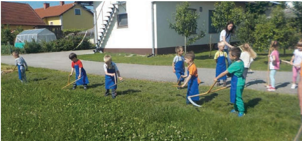
Košnja mladih koscev