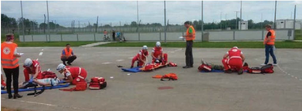
Ekipo prve pomoči OORK Markovci v laični oskrbi ponesrečencev.