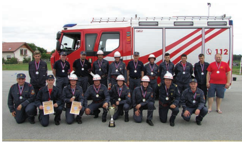
Člani domačega društva so v svoji kategoriji dosegli 1. in 2. mesto.