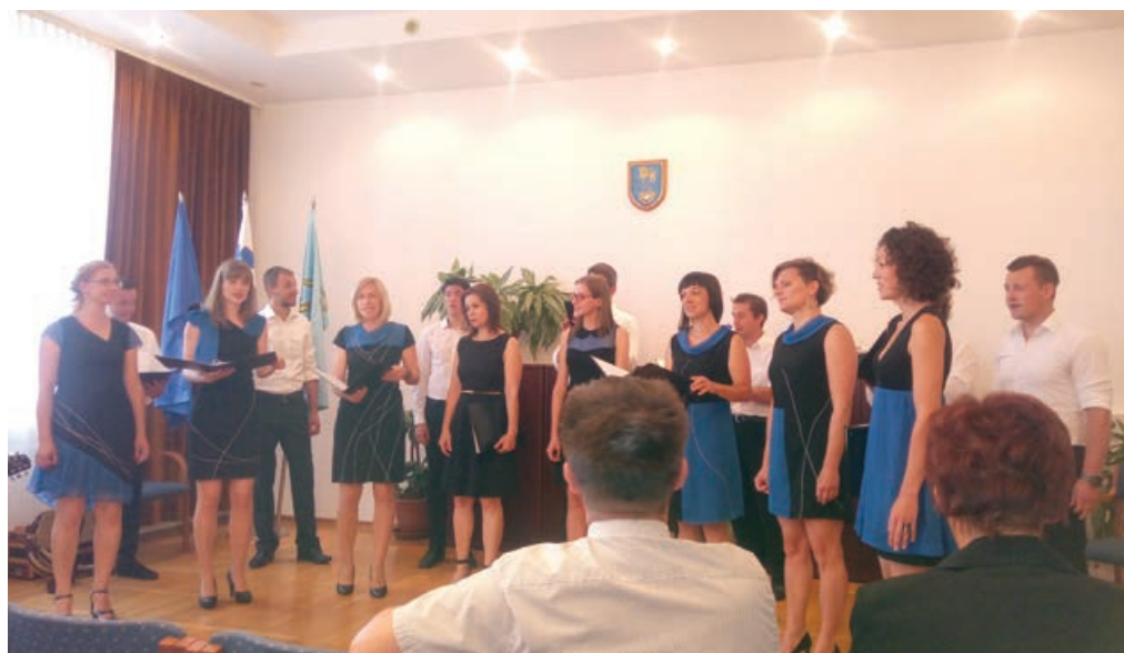
Komorni zbor Kor