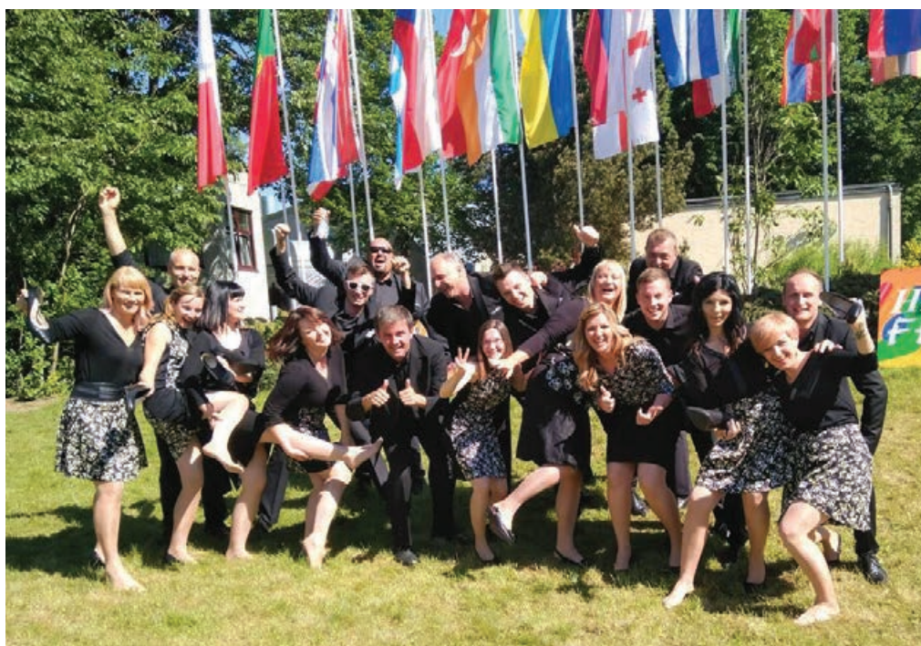
Občutki ob uspehu so bili prežeti z veseljem in zadovoljstvom.