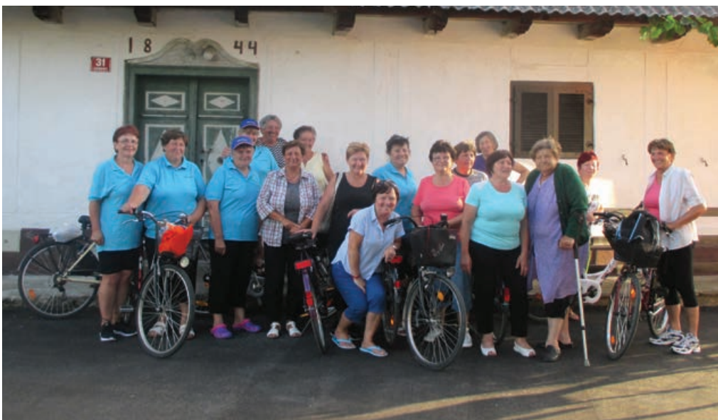
Članice DPŽ so kolesarile do Vidma in nazaj.