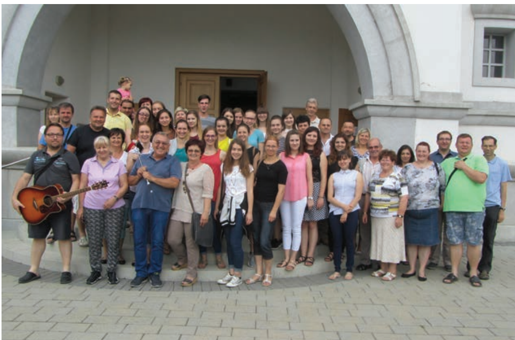
Letos smo se na zaključni izlet podali v Prekmurje. V Odrancih (na fotografiji) so nas zelo lepo sprejeli.