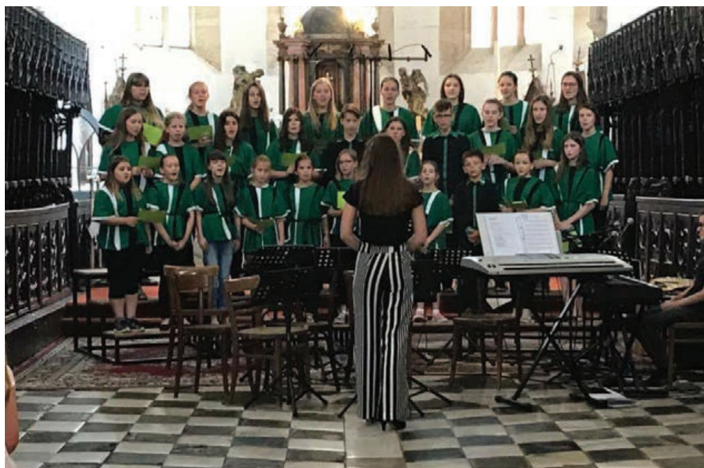
Najmlajši člani društva so zapeli tudi na cerkveni reviji.

Po uspešnem sodelovanju z Moškim pevskim zborom Markovci in izvedenim koncertom Pa se sliši v mesecu marcu smo se tokrat povezali še z Akademskim