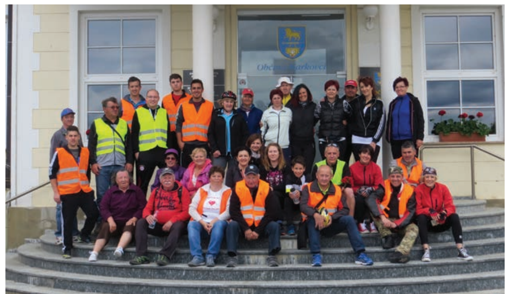
S kolesi okrog naše občine