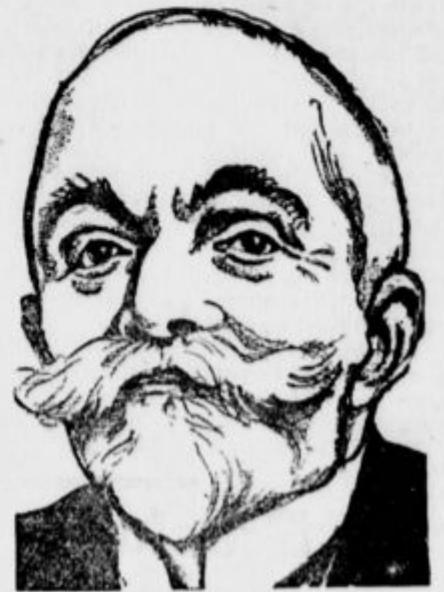
Bivši drž. predsednik Portugalske, Machado, ki vodi sedanje uporno gibanje

Madrid, 12. aprila. AA. Španska vlada je odredila, da bodo volivci, ki so se odtegnili nepravilno volilnim dolžnostim, vpisani v tako zvane »črne liste«. Ako ne bodo volili tudi pri prihodnjih volitvah, bodo kaznovani z občutnimi denarnimi globami. Med drugim bo državnim uradnikom v tem primeru odtegnjeno od plače 1%.