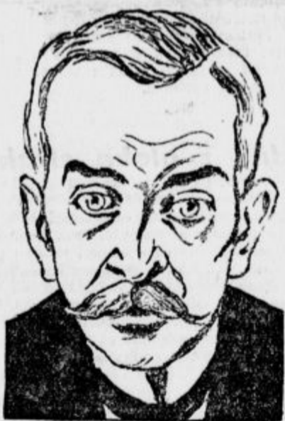
Portugalski drž. predsednik general Carmona