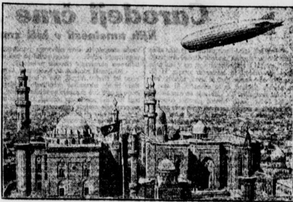
Graf Zeppelin nad kairskimi minareti. Predvčeršnjim je pristal Graf Zeppelin v Kairu. Ob tej priliki je imelo zbrano občinstvo priliko videti skok z zračne ladje s padalom. Član posadke je skočil s padalom raz krov Zeppelina, ko je bil ta še 120 metrov visoko. Imel je nalogo, da da gotova navodila moštva, ki je pomagalo pri pristanku.