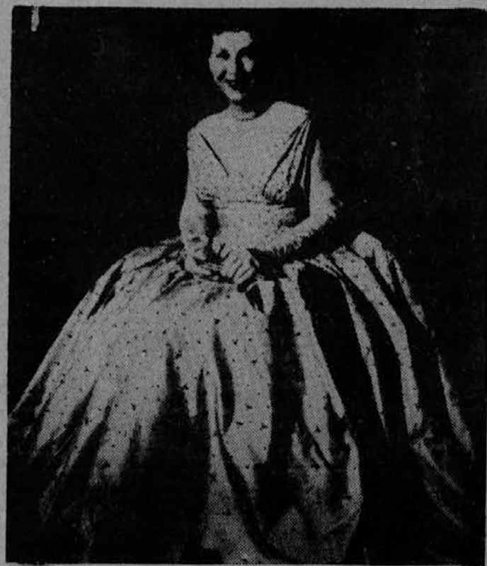
FIRST LADY of the LAND MAMIE EISENHOWER Lovely wife and mother

GLASILO SLOVENSKE ŽENSKÉ ZVEZE V AMERIKI