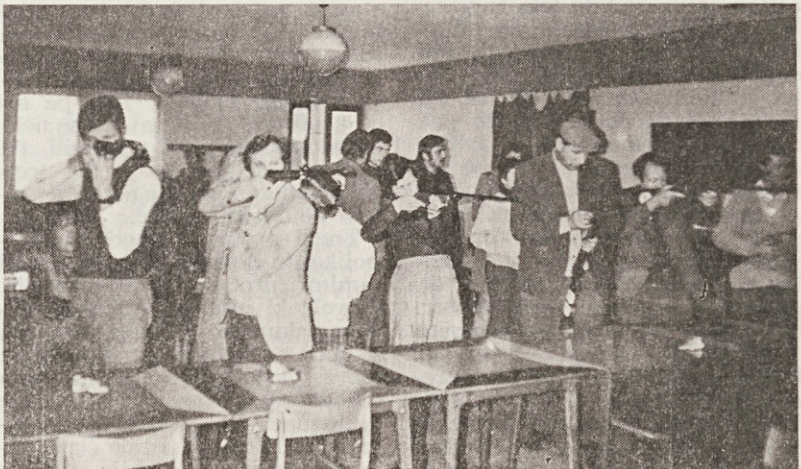
Uspela TRIM akcija v streljanju

Prvi korak v takšne akcije je na Brestu naletel na ugoden odziv, saj je bilo sodelovanje izredno. 19. decembra je imel vsakdo iz naše delovne organizacije — ne glede na znanje v streljanju možnost sodelovati v trim akciji v tej panogi. Udeleženec je moral odstreljati deset stre-