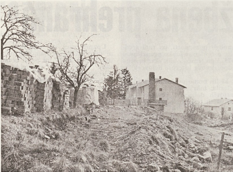
Številne nove gradnje

Po končanem programu je prišel vesel trenutek, ko je dedek Mraz razdelil vsakemu učencu osnovne šole IGA VAS prikupno darilo, ki ga je prispevala zavarovalnica SAVA — poslovna enota Postojna.