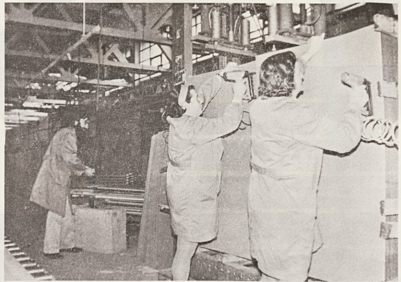
Delavke v Tovarni pohištva Cerknica