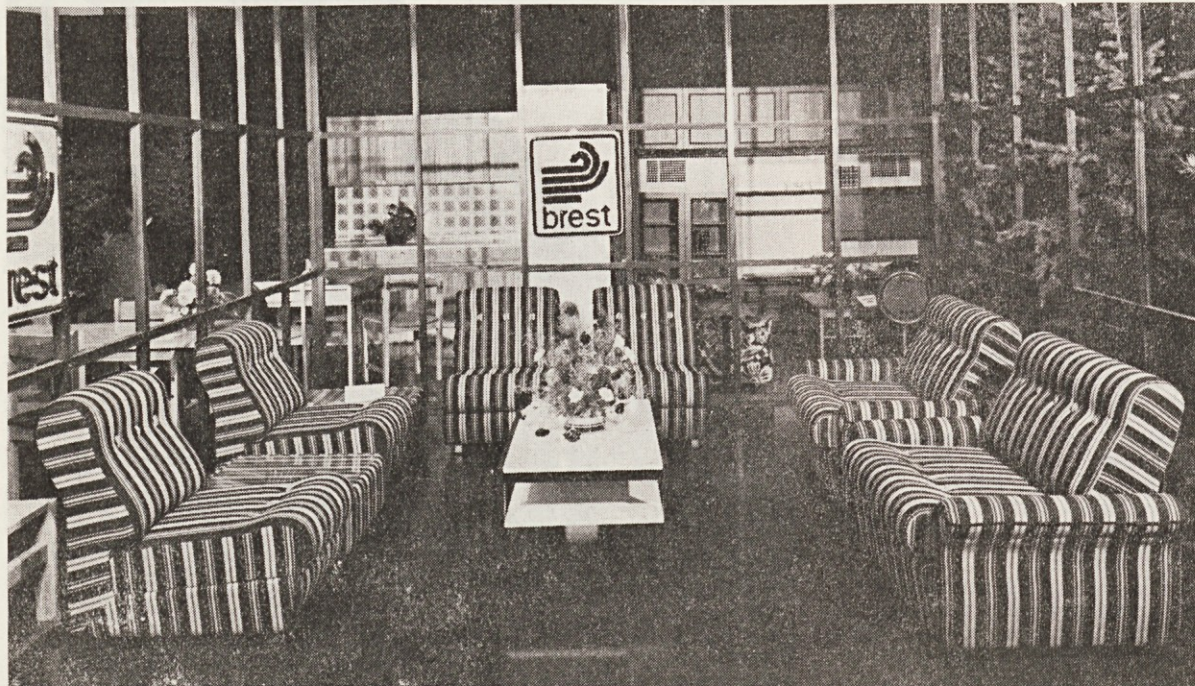
Novo v naši proizvodnji — program MOJCA

Verjetno bomo morali še povečati izbiro tapetniškega blaga, da bo izdelek ustrezal vsakemu ambientu in okusu. M. Geršak