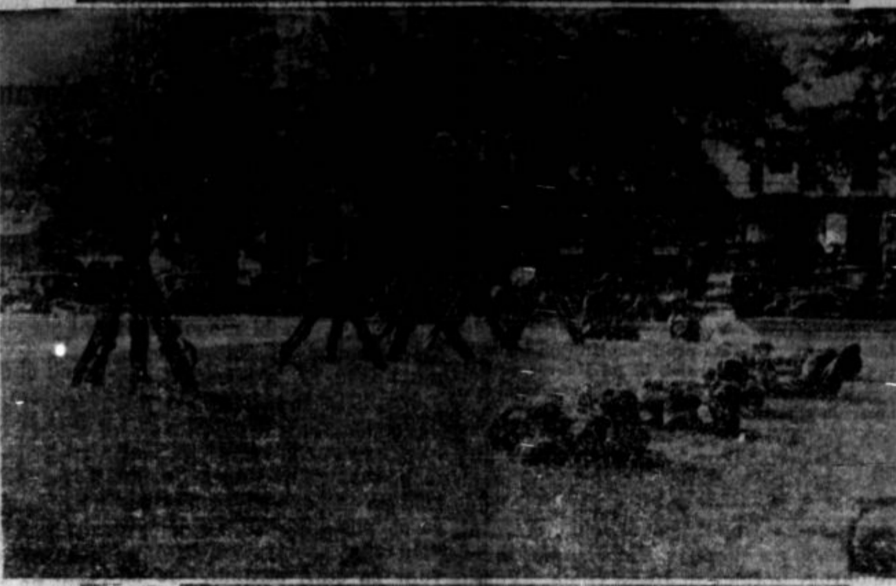
Na sliki je oddelek illinoiske državne milice, ki je bila poslana v okrožje Taylorvillu, da protektrira interese kompanije in nastopi proti piketom, ako potrebno. Kadar koli je pozvano vojaštvo v akcijo, je to vselej zato, da brani privatne interese. Šele kadar bo delavstvo poslalo v zakonodaje in na governorjevo mesto svoje zastopnike, prenehajo take slike in razmere kakrni imamo danes.