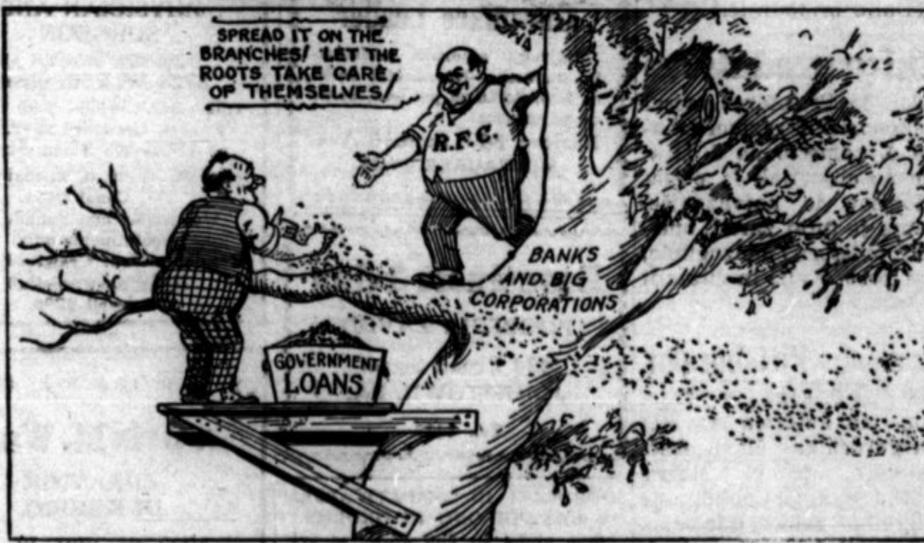
It is folly to fertilize the branches of the tree when—