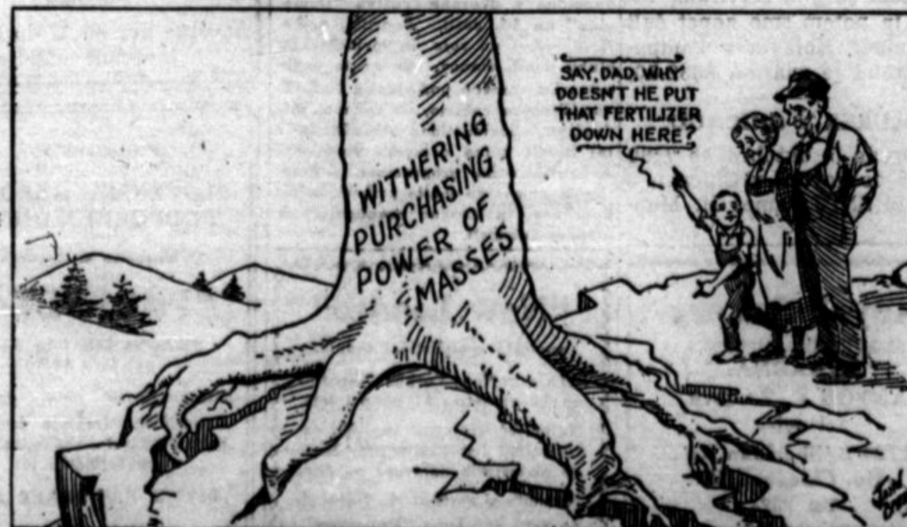
The life-giving roots are being utterly neglected.