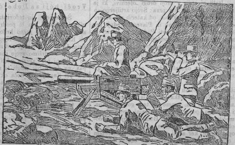
Österreichische Maschinengewehrabteilung im Kriege

Boj z izdajalsko Italijo se razvija zdaj večinoma v skalnatem visokem gorovju, deloma celo v večnem snegu. Naša slika kaže avstrijski oddelek strojnih pušk v skalnatem ozemlju Krna, kjer smo doslej same lepe uspehe dosegli.