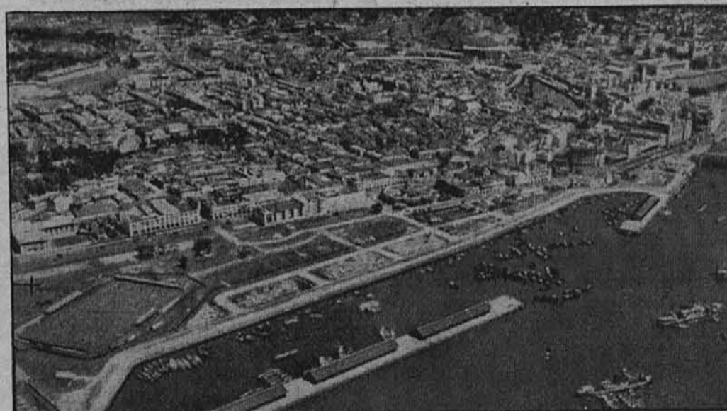
Pred napadom na Singapur

Borba za Singapur se je pričela. Posebno pristaniške naprave v mestu so neprestano izpostavljene japonskim napadom. Nad doki v pristanišču se dviga gost dim. Kakor pravijo najnovejša poročila, so britanske ladje pristanišče že zapustile. — Gornja slika nam kaže zračni posnetek dela pristanišča.