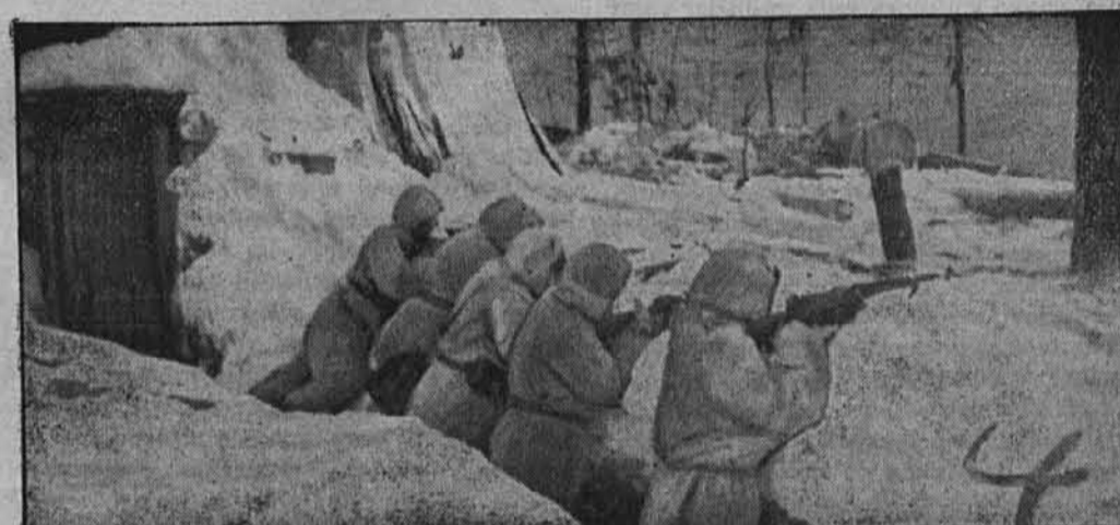
Finski pešci v obrambnem boju

Med viharjem in v ledenem mrazu nadaljujejo Finci z borbo za svobodo svoje dežele. Finski vojak je sedaj v dveh nepojmljivo trdih in ogorčenih vojnah ohranil svojo slavno staro vojaško tradicijo. Slika nam kaže finske pešce v strelnem jarku na odseku Peventsä.