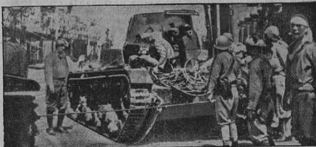
Britanski oklopnjak, ki so ga zaplenili Japonci na Malaji Uplenili so ga japonski vojaki na svojem prodiranju.