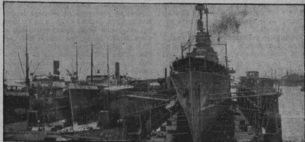
Prvi napad na Surabajo

Japonska zračna sila je izvedla prvi veliki zračni napad na nizozemski Sunda-otok Javo, pri čemer je nastala na letališčih v Surabaji, Malangu, Madjoenu in Magetanu občutna materialna škoda. — Slika nam prikazuje del pristaniških naprav z doki v Surabaji, ki je najvažnejše izvozno pristanišče na Javi.