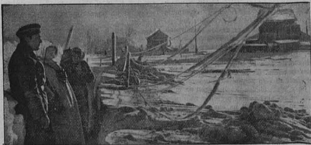
V nemških postojankah pred obleganim Leningradom

Japonska zračna sila je izvedla prvi veliki zračni napad na nizozemski Sunda-otok Javo, pri čemer je nastala na letališčih v Surabaji, Malangu, Madjoenu in Magetanu občutna materialna škoda. — Slika nam prikazuje del pristaniških naprav z doki v Surabaji, ki je najvažnejše izvozno pristanišče na Javi.