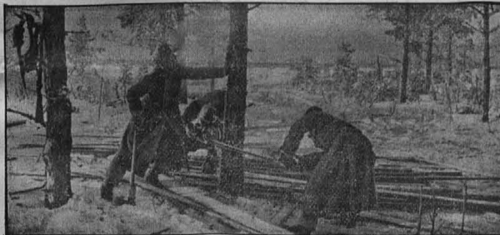
Za izgradnjo naših položajev na vzhodu morajo vedno znova podirati drevesa v bližini. Kljub krutemu mrazu, ne sme delo niti za trenutek počivati.