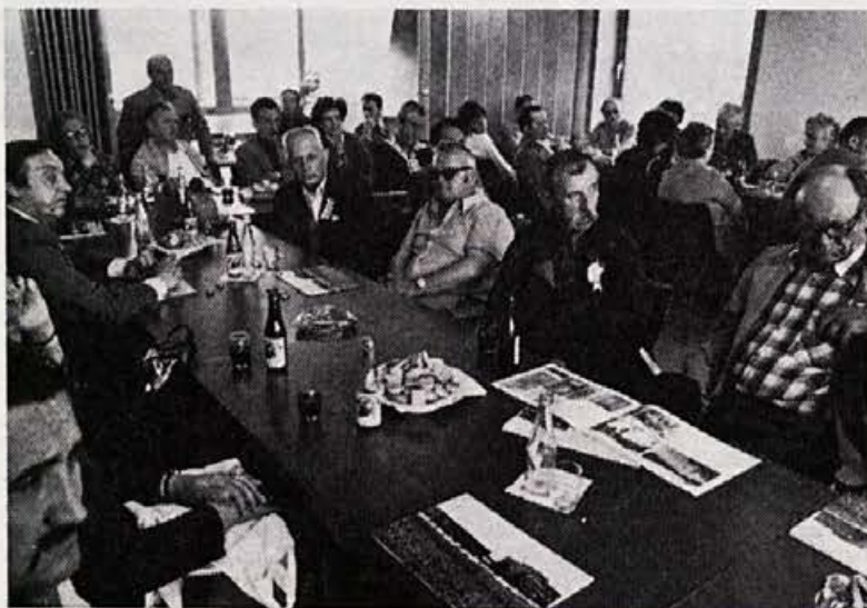
Vlak bratstva in enotnosti je nekaj gostov pripeljal tudi na ogled Elana