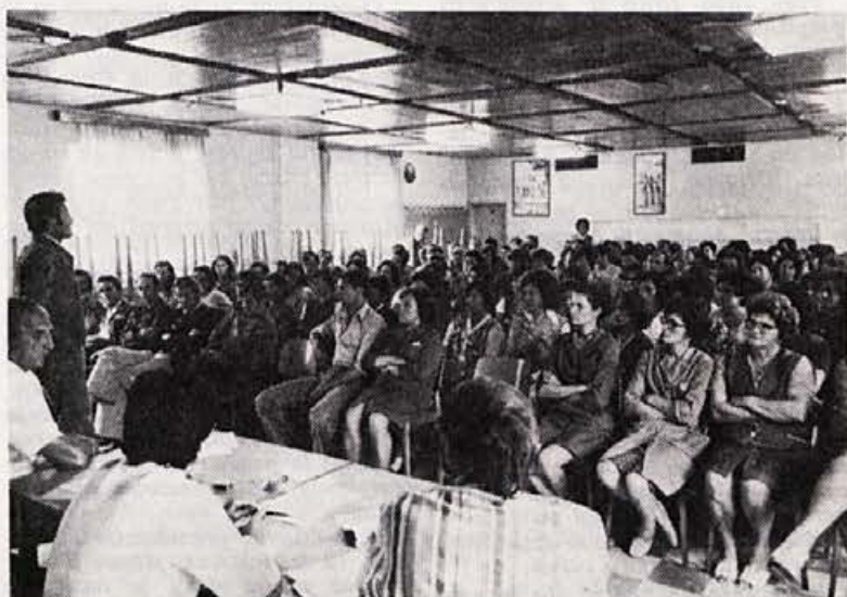
Ob razpravi na zboru delavcev TOZD-SR

Ustanovitev dveh TOZD je pogojevalo panožno načelo, saj sta bili obe temeljni organizaciji še pred konsti-