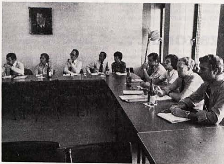
Delovni sestanek naših inozemskih predstavnikov

Pri osebnih dohodkih naj posebej naglasim, da spoštujemo resolucijo o družbenem ekonomskem razvoju SR Slovenije in pomožni samoupravni sporazum o delitvi osebnih dohodkov in dohodka. Povprečni