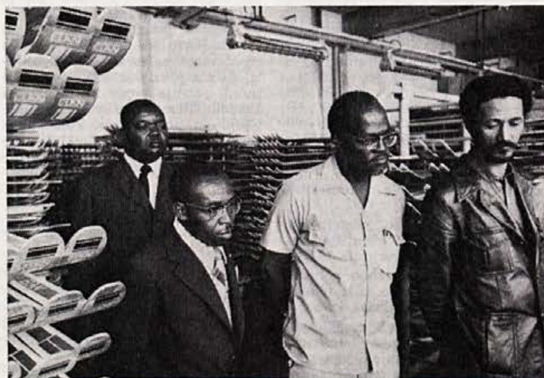
Sindikalni funkcionarji Ugande, Gane, Nigerije, Zimbabve, Etiopije in Zambije na obisku pri nas