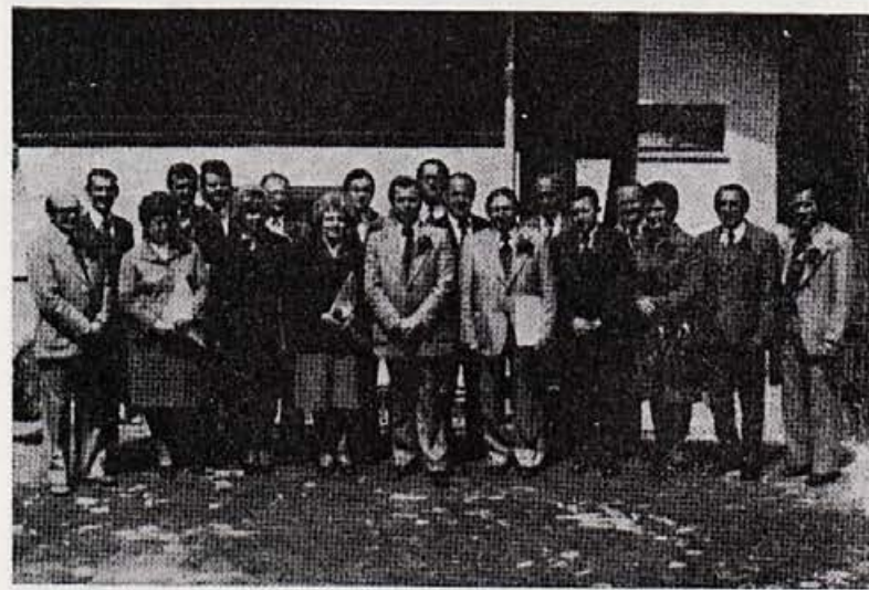
Dobitniki srebrne sindikalne značke