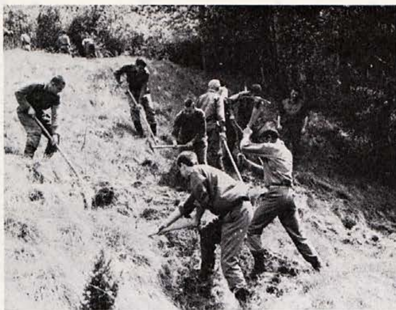
Pri pripravi proge na »Hraški gmajni« za moto cross, so marljivo pomagali tudi vojaki iz Boh. Bele in Radovljice