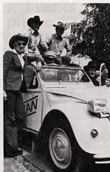
Amerikanci? Ne. Naši domači uporabniki cest. Ali jih poznate?

Svetovni pokal tekačev bo prihodnjo sezono že četrtič, še vedno pa je neuraden. V poštev pride 10 prireditev s skupno 13 tekmami. Stela pa se bo za svetovni pokal le taka tekma, kjer bo startalo najmanj 10 tekmovalcev, ki so v pretekli sezoni nabrali vsaj 20 ali več točk za svetovni pokal. V pretekli sezoni je doseglo najmanj 20 točk 42 tekmovalcev.